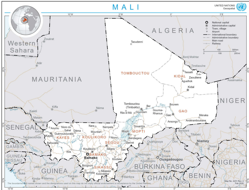
Figure 17: United Nations Geospatial Section (2021) General Maps: Mali. At

( https://www.un.org/geospatial/content/mali-1 , accessed August 15, 2021)