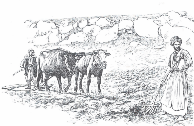
Abb. 5: Diese Zeichnung gibt den Dreschvorgang im 20. Jahrhundert n. Chr. wieder, entspricht aber der alttestamentlichen Zeit: Rinder zogen einen einfachen Dreschschlitten, der tagelang über das geerntete Getreide fuhr: Durch die an der Unterseite des Dreschschlittens eingelassenen Flintsteine lösten sich allmählich die Körner aus den Ähren.

deihen (vgl. Ps 144,12-14). Es nimmt daher nicht wunder, dass in weisheitlichen Texten und vor allem alten Rechtsbestimmungen, die dezidiert auf die Lebenswirklichkeit der Menschen ausgerichtet sind, das Verhältnis Mensch-Tier in den Blick rückt. Diese Texte sollen jetzt betrachtet werden.