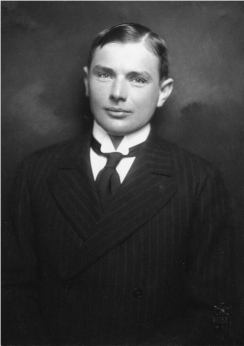
Abb. 2: Rudolf Kassner.