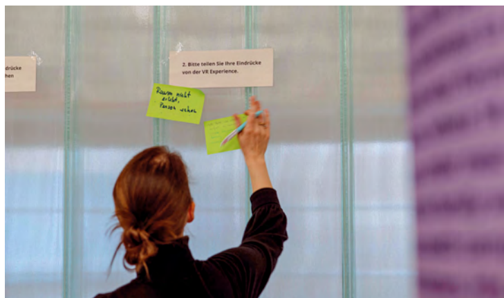
Abb. 1: Workshopssituation mit erwachsenen Teilnehmenden, Potsdam, 2024

Das erprobte Workshopformat hatte auch seine Grenzen, insbesondere durch die zeitliche Begrenzung und die fehlende Möglichkeit einer langfristigen pädagogischen Begleitung. Nichtsdestotrotz lieferten die Erwachsenen-Workshops wertvolle Impulse für die Weiterentwicklung digitaler Geschichtsvermittlung und demonstrierten eindrucksvoll, wie verschiedene Generationen gemeinsam an der Zukunft von Erinnerungsarbeit mitwirken können.