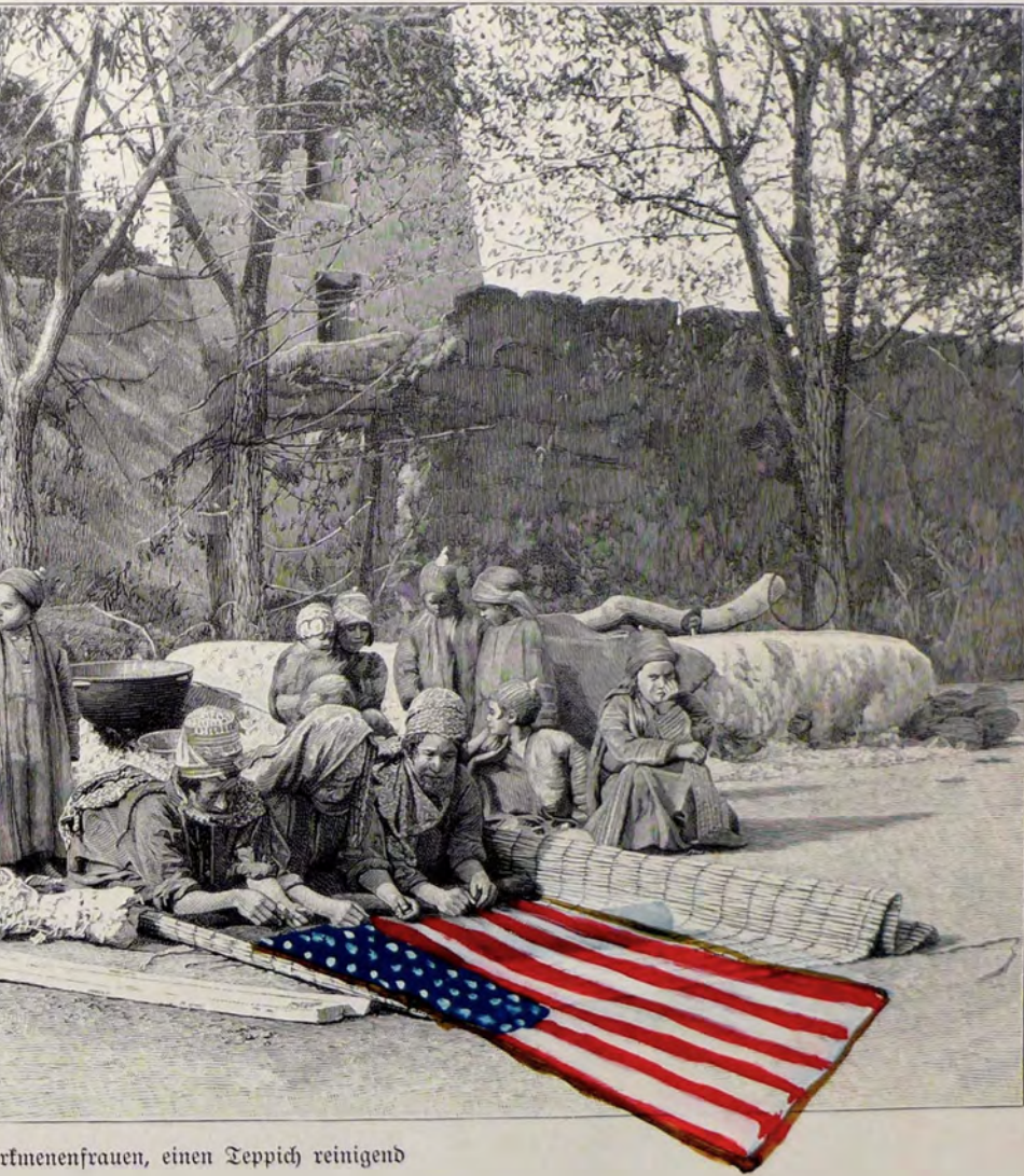
Armenienfrauen, einen Teppich reinigend