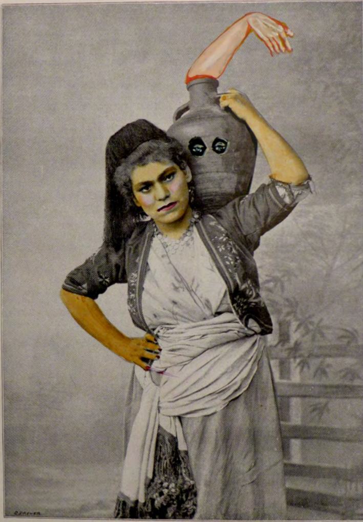
Sampert, Söfter der Erde