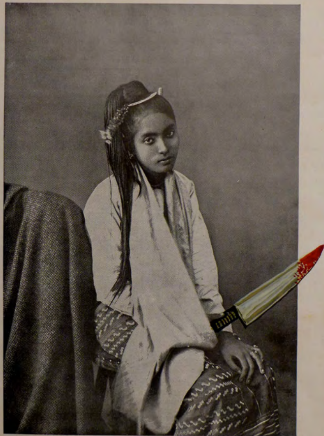
Шиманифес Mädchen aus Mandalay