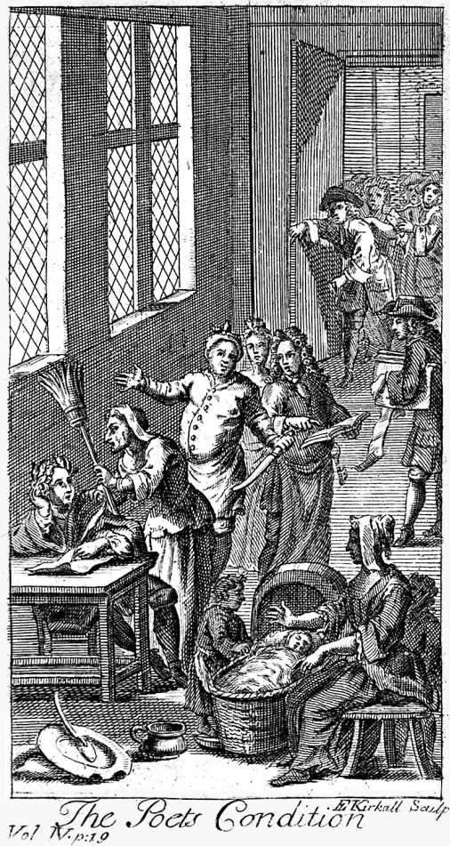
Abb. 6 The Poets condition , aus: The Works of Mr. Thomas Brown, Fourth and last Volume , London 1730

Als literarischer Selbstunternehmer hatte Brown ein gutes Gespür für das Funktionieren der neuen, kapitalistischen Ökonomie, die in seinen Schriften unter dem Namen «Trade» firmiert. In seinen Amusements spottet er über die neue merkantile Klasse und ihr «mystery of Trade»: «A Term unintelligible to Foreigners, and that none truly understand the Meaning of, but those that practice it.» 41 Zugleich lässt er seinen indianischen Weggefährten (der offenbar als Fachmann für Idolatrie betrachtet wird) eine Art Fetischkritik der Wertvergesellschaftung formulieren: «What cannot you be content, says our