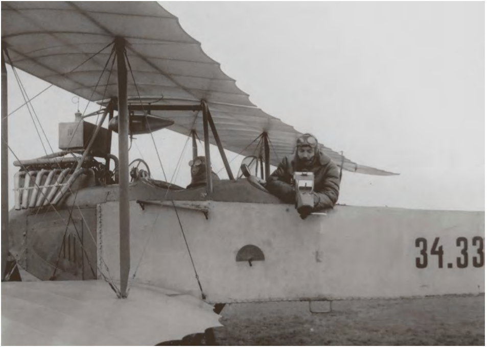
Abb. 12 Fotografische Luftaufklärung, Doppeldecker der k.u.k. Fliegerkompagnie in Kolomea, Ostgalizien, 1916 (Fotografie)