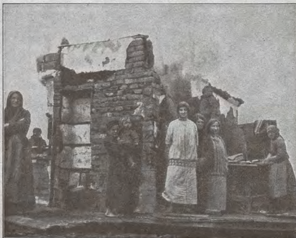
Nach der Befreiung: Bewohner eines russischen Dorfes bei der Bereitung einer Mahlzeit in den Trümmern ihres zerstörten Hauses.

Besser als alle Beschreibungen zeigen Bilder, was das Wort „Krieg“ bedeutet. Aber auch die Photographien können nur einen matten Eindruck vermitteln von dem grauenhaften Anblick, den eine vom Krieg gekämpfte Gegend, ein niedergeschmettertes Dorf, ein von Orkanen zerlegter Wald bietet. Der eiserne Wall um deutsches Land hat bewirkt, daß die Heimat bis auf kleine Zelle, die zum Beginn des Krieges von Weltbrand erreicht wurden, keinen Feind gesehen hat und von den Kampfjahren verschont geblieben ist. — Die Wirkung der schweren Geschütze, wie sie jetzt besonders in der endlosen Sommer-