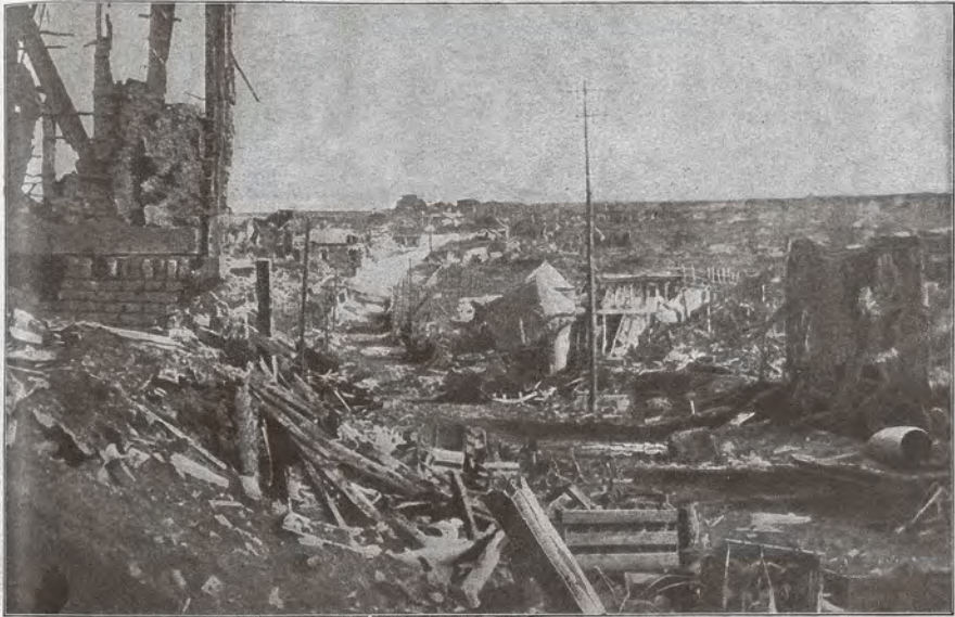
Wie die Ortschaften aussehen, die die Feinde in der Sommeschlacht erobert: Combles!