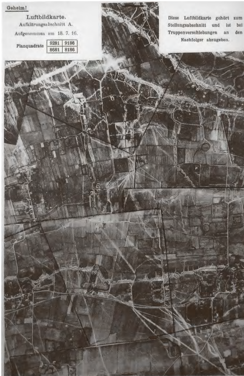
Abb. 13 Luftbildkarte »Aufklärungsabschnitt A«, 18.7.1916 (zehn montierte Fotografien, die ursprünglich schräg aufgenommen wurden; anschließend wurden sie in Bildauswertern entzerrt, um sie aus Ermangelung geeigneter Detailkarten als senkrecht aufgenommene Bilder der Landschaft zu nutzen)