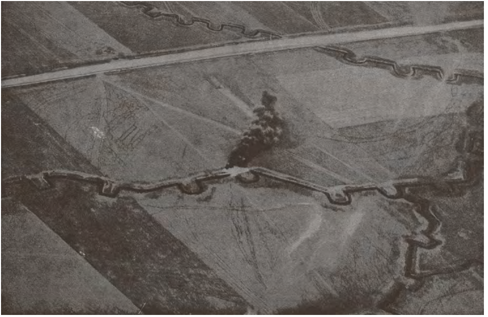
Abb. 16 Luftaufnahme »Flammenwerfer-Angriff an der Westfront«, 1917 (Fotografie von einem deutschen Flugzeug aus aufgenommen)