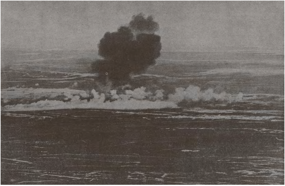
Abb. 15 Luftaufnahme »Flammenwerfer-Angriff«, 1917 (Fotografie von einem deutschen Fesselballon aus aufgenommen)