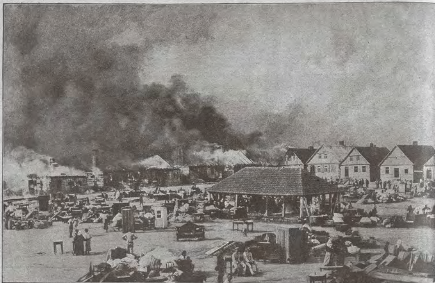
Was Krieg heißt: Ein russisches Dorf, das die Russen in Brand gesteckt haben; kurz nach der Befreiung durch unsere Truppen aufgenommen.