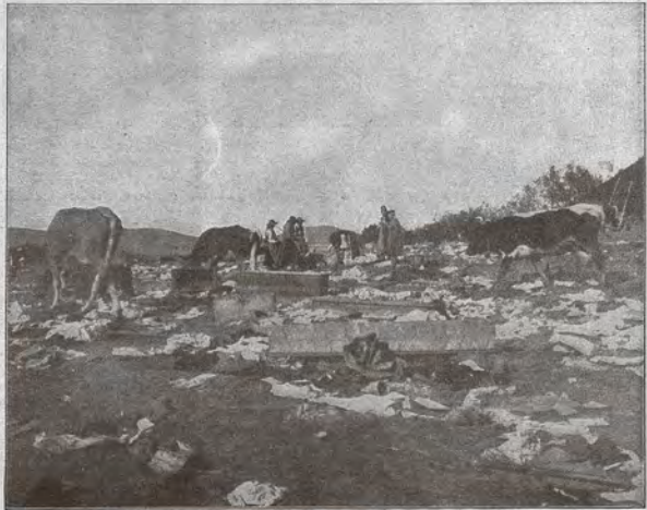
Landschaftsbild vom Eingang des roten-Turms-Passes nach dem eiligen Rückzug der rumänischen Truppen.