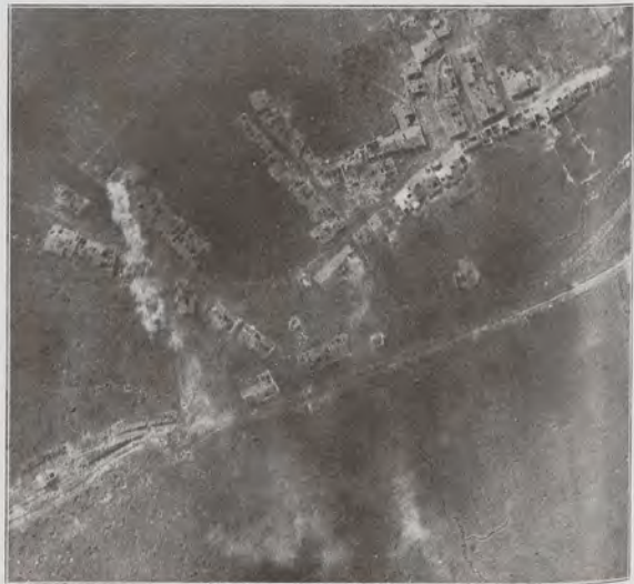
Fleury-devant-Douaumont à la date du 25 mars 1916.

L'œuvre du général Nivelles, commandant la 2 e armée, et du général Mangin, commandant le secteur, va être de déloger l'ennemi de ce terrain, de récupérer toutes les pentes et le village et de tenir la crête. Les combats de Fleury sont en liaison étroite avec les combats sur Thiaumont et sur la Chapelle Sainte-Fine. Il est évidemment arbitraire de la traiter à part. Mais, dans cette guerre, aucun fait ne peut être isolé. La bataille de Verdun même est,