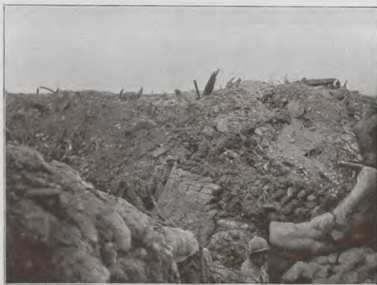
Emplacement de l'église de Fleury après la reprise du village par le régiment colonial du Maroc, le 18 août.

Le commencement du mois d'août est fertile en magnifiques actions sur Thiaumont et sur Fleury. Tandis que les 81 e et 96 e régiments s'illustrent à Thiaumont, les régiments de la 15 e division viennent tour à tour se battre et progresser aux abords de Fleury, puis dans le village. C'est le colonel Leschères qui dirige cette progression. Le 56 e la commence, le 10 e la continue, malgré des pertes sensibles. Le commandant Tisserand-Delange, le capitaine Donaret sont tués. Mais nous avons avancé notre ligne sur le chemin de la Poudrière à Fleury, fait 350 prisonniers, capturé 11 mitrailleuses (2 août). Nos hommes gravissent les pentes, atteignent la station. La station est prise. C'était l'objectif fixé, la limite assignée provisoirement à la progression. L'objectif est atteint, la limite est même dépassée légèrement.