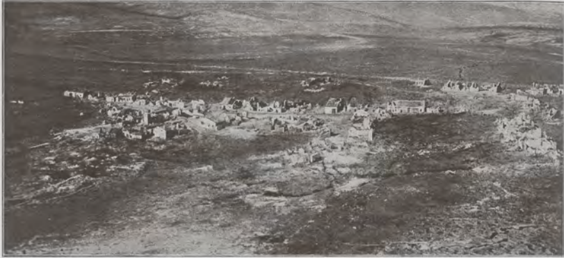
Le village de Fleury-devant-Douaumont en mai 1916.