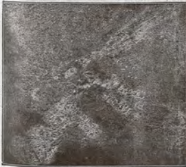
2. Flieger-Aufnahme, die den zerstörtesten Ort Fleury vier Monate später nach den großen Beschießungen zeigt.

Schlacht zur Geltung kommt, ist imstande eine Landschaft derart zu verwandeln, daß sie der Einwohner nicht wiedererkennt, wenn man ihn an die Stätte führt, wo sein Haus stand. Flieger-Photographien zeigen Bilder, die wie Mondlandschaften aussehen. Krater reiht sich an Krater, die Schützengräben durchsurchen das Land und von Haus und Strauch ist keine Spur mehr zu sehen. Die Orte, die die Feinde in der Sommeschlacht wieder besetzen, sind kaum als solche zu erkennen: ein wüster Steinhaufen bezeichnet die Stelle, wo das Dorf Combles lag. Rein Naturereignis, kein Erdbeben kann so grauenvolle Zerstörungsarbeit verrichten!