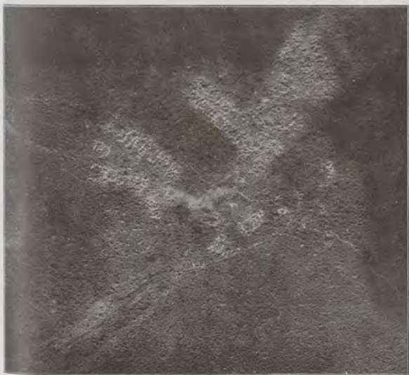
Fleury-devant-Douaumont, quatre mois après, le 25 juillet 1916.

Il faudrait consacrer un chapitre spécial à l'enlèvement de la Poudrière, ouvrage au Sud de Fleury (rent du 19 au 20 juillet), par le bataillon Thomas, des 2 e zouaves, qui en chasse un bataillon du 11 e régiment bavarois. La Poudrière prise, c'est l'accès Sud-Ouest de Fleury dégagé; les zouaves progressent par le ravin où ils font des prisonniers. Nous avançons à l'Ouest de la Chapelle Sainte-Fine. Dès le 15 juillet, nous avons repris l'ascendant perdu.