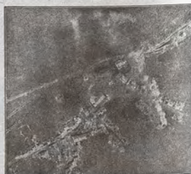
Zerstampf! 1. Flieger-Aufnahme des Ortes Fleury bei Verdun. (Aus einer französischen Zeitschrift.)

Besser als alle Beschreibungen zeigen Bilder, was das Wort „Krieg“ bedeutet. Aber auch die Photographien können nur einen matten Eindruck vermitteln von dem grauenhaften Anblick, den eine vom Krieg gekämpfte Gegend, ein niedergeschmettertes Dorf, ein von Orkanen zerlegter Wald bietet. Der eiserne Wall um deutsches Land hat bewirkt, daß die Heimat bis auf kleine Zelle, die zum Beginn des Krieges von Weltbrand erreicht wurden, keinen Feind gesehen hat und von den Kampfjahren verschont geblieben ist. — Die Wirkung der schweren Geschütze, wie sie jetzt besonders in der endlosen Sommer-