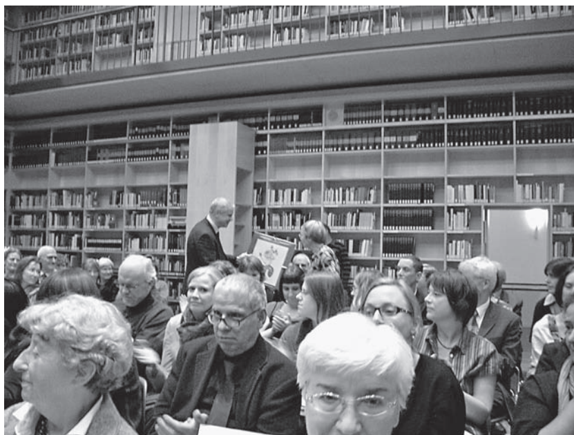
Eröffnungsabend im Bücherkubus