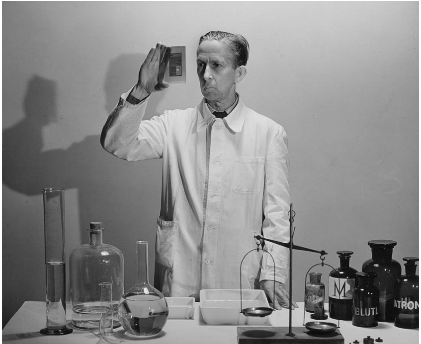
Abb. 1: Hans Finsler, Kunstgewerbeschule Zürich, 1943.

Mit strengem Blick mustert Hans Finsler ein Fotonegativ. Unter seinem weißen Laborkittelkragen ragt ein hochgeknöpftes Hemd mit eng gebundener Krawatte hervor. Auf einem Tisch vor ihm stehen sorgfältig platzierte Glasflaschen mit Chemikalien, eine Waage sowie weitere Utensilien für die Fotoentwicklung. Diese Aufnahme lässt kaum Interpretationsspielraum offen: Armin J. Haab inszenierte seinen Fotografielehrer nicht als leidenschaftlichen Fotografen in Aktion, sondern als penibel wirkenden Wissenschaftler. Finsler wird hier – nicht zuletzt auch vestimentär – zur Verkörperung der Neuen Sachlichkeit überstilisiert: streng, ordentlich, nüchtern und unmissverständlich: «Sobald man Ambiguität an einem Ende zurückdrängt, entsteht sie an einem anderen Ende und in oft unerwarteter Form wieder neu.» 1