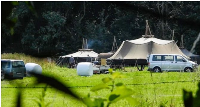
Abbildung 1: Lager des Freibund im Sommer 2024