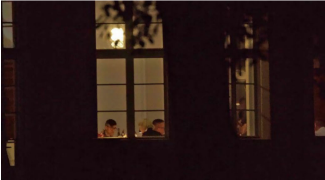
Abbildung 2: Martin Sellner bei dem Potsdamer »Geheimtreffen«