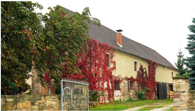
Abbildung 3: Institut für Staatspolitik in Schnellroda