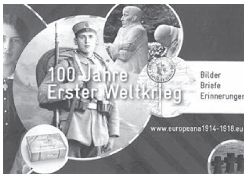
Abb. 1: Postkarte zum Projekt