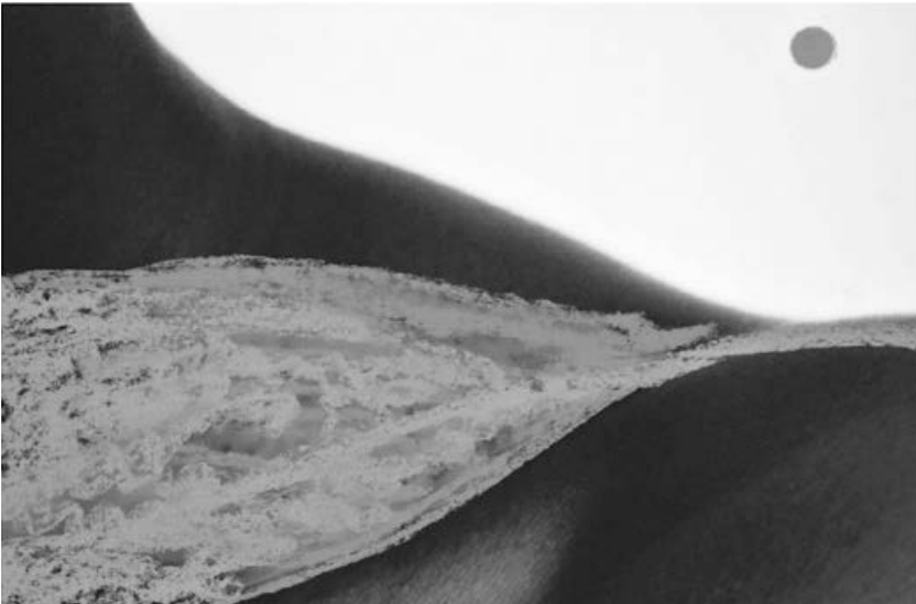
Abb. 2 Binta Diaw: Paysage Corporel III , 2018 (Orig. in Farbe)

Leben jenseits der Geschichtlichkeit von Kolonialismus und Kapitalismus möglich werden kann.