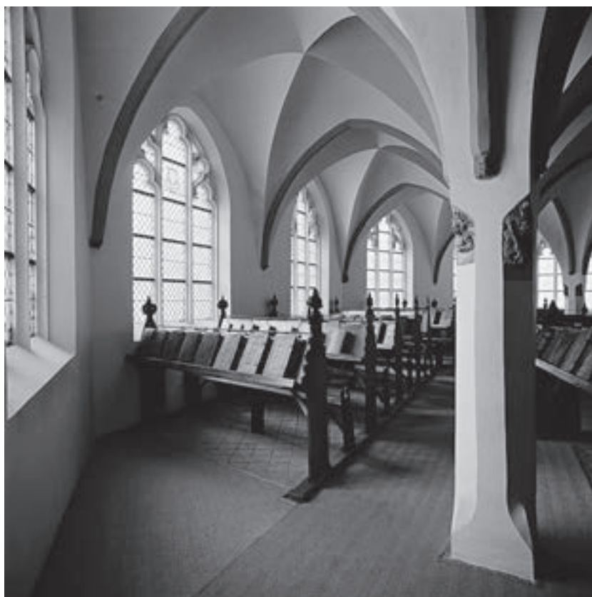
Abb. 1: Kettenbibliothek Zutphen

zung der Bibliothek immer mehr; sie hatte nur noch museale Funktion. Den Zweiten Weltkrieg überstand sie unbeschadet. 1984 wurde eine Stiftung gegründet, unter deren Obhut nun die Bibliothek mit ihrem gesamten Inventar steht. Seit 2006 ist die Kettenbibliothek – eine der wenigen erhaltenen – ein Museum ( www.librije-zutphen.nl ).