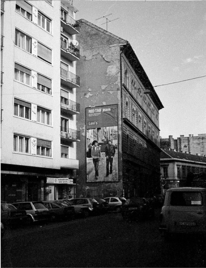
global players: Budapest