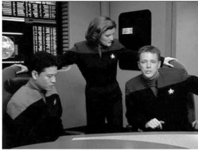
Abb. 1: Janeway mit Crew