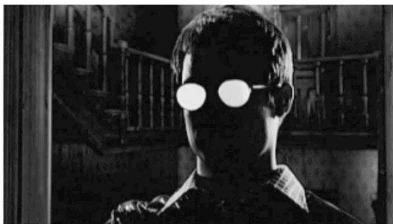
Aus: Sin City