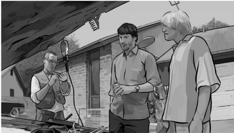
Aus: A Scanner Darkly

Dieser Look wurde in zwei Schritten erreicht. Zunächst wurde der Film wie jeder andere Spielfilm in Studiosets und an Außendrehorten mit den Schauspielerinnen und Schauspielern gefilmt und aus dem Material ein Rohschnitt gefertigt. In einer zweiten Phase wurden alle Bilder des Films mit Hilfe einer Zeichensoftware Bild für Bild regelrecht übermalt und Hintergründe, Objekte, Körperteile nachträglich animiert. 12 Mal dominiert das Zeichnerische und der Film vermittelt das Gefühl, dass alle Bildanteile animiert sind, mal sind »unter« den Zeichenelementen sehr deutlich die Körper der Schauspieler und die Spielorte zu erkennen, so dass die Nähe zum Spielfilm sichtbar wird. So glaubt z.B. einer der Figuren der Eröffnungssequenz des Films im Drogenwahn, dass sein Körper von kopflausähnlichen Insekten bevölkert wird. Seine vielfachen Versuche, sich von dem Ungeziefer zu befreien, sind jedoch erfolglos. Bemerkenswert an der Inszenierung seines Kampfes mit den nicht-existenten Insekten ist die sichtbare Hybridität der Bilder: Während Teile des Körpers immer wieder an ihre eigentliche Räumlichkeit erinnern und deutlich zu erkennen ist, dass hier ein Schauspieler vor der Kamera gestanden hat, sind andere Körperteile – insbesondere der Kopf und die Haare als Ausgangspunkt der Kopflausinvasion – ganz deutlich als grafisches, am Computer gezeichnetes Element zu erkennen: Im Gegensatz zum Rest des Körpers erscheinen diese Partien grundsätzlich flächig.