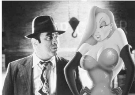
Abb. 1: Schauspielerkörper und gezeichneter Hase sind in einem Bild zu sehen, allerdings sind die verschiedenen Bildebenen deutlich erkennbar