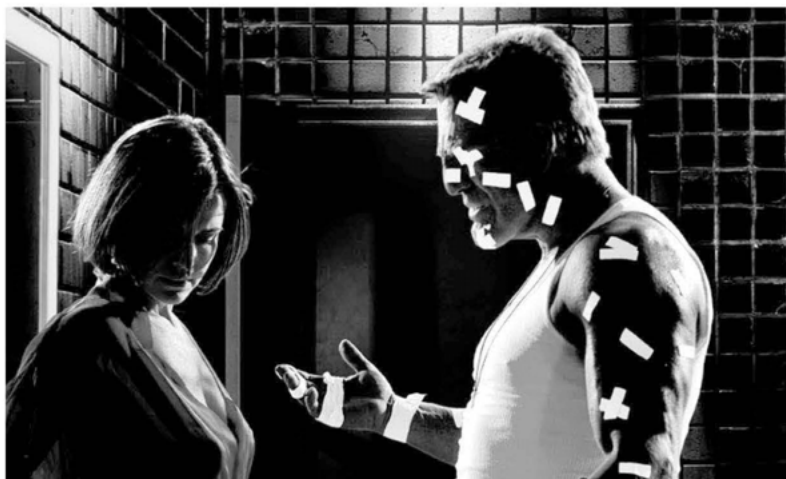
Aus: Sin City