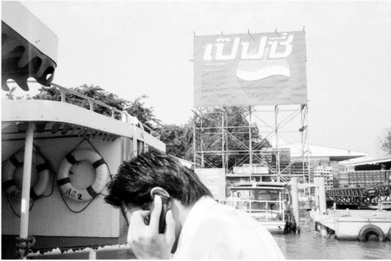
global players: Bangkok