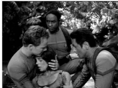
Aus: VOY 3x16: Pon Farr

Paris' und Torres' spätere Verbindung und Ehe führt zu einer ›Zähmung‹ der wilden Klingonin, was sich bereits in Pon Farr abzeichnet. Durch ihre Partnerschaft lernt sie, sowohl ihre klingonische Seite zu akzeptieren als auch sie zu kontrollieren. Aus dem Action Girl wird eine liebende Ehefrau und vorbildliche Mutter in spe. In der letzten Voyager -Folge 22 wird die einst so waghalsige wie aktive Torres vollends auf die Mutterrolle reduziert. Sie arbeitet