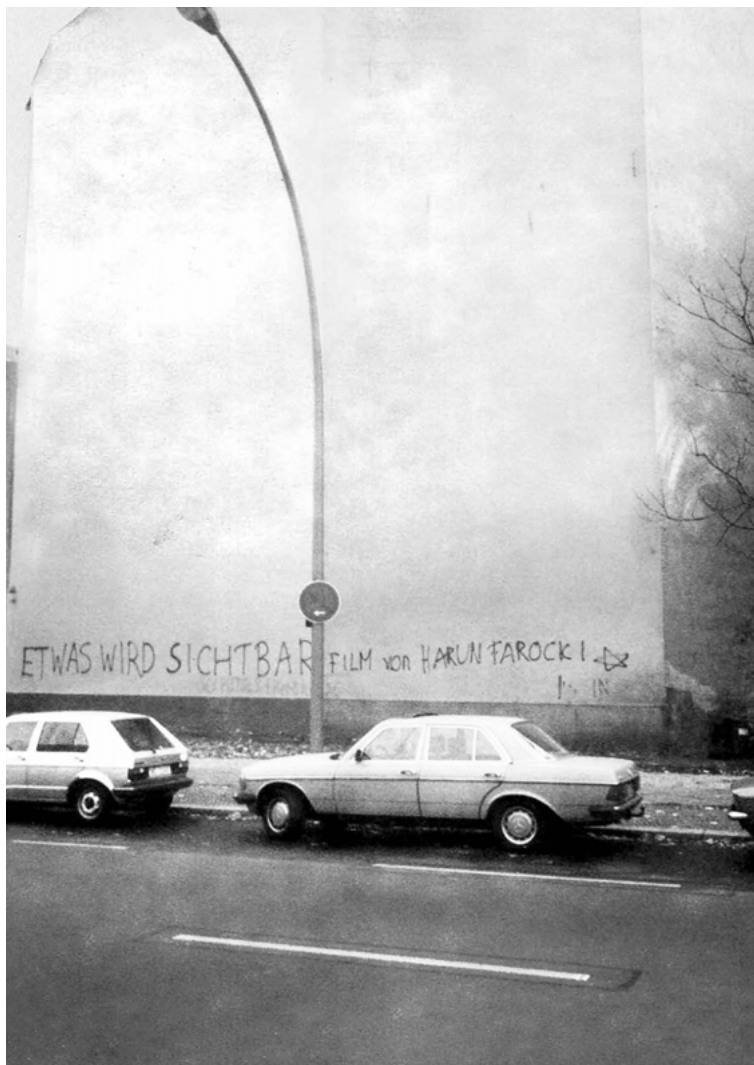
Abb. 1 Graffito von Harun Farocki, Lietzenburger Straße/Welserstraße (West-Berlin) als Werbemaßnahme für seinen Film Etwas wird sichtbar (1982)