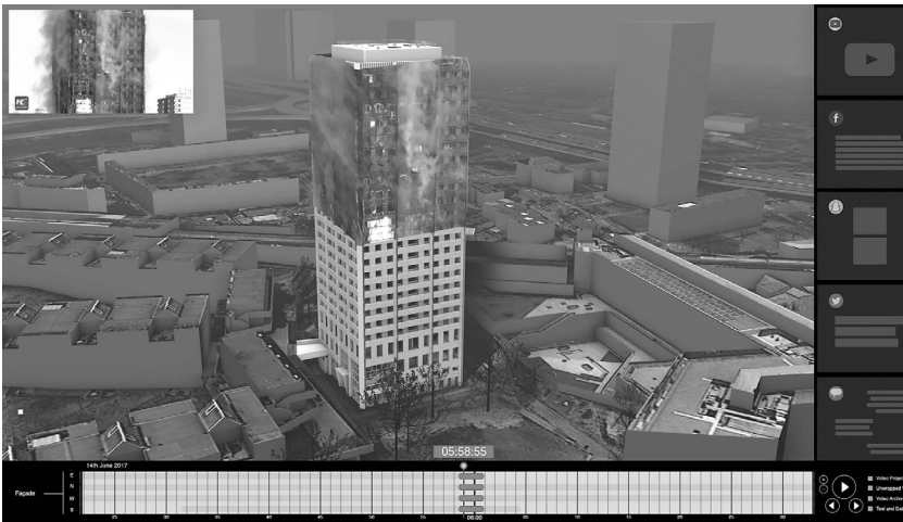
Abb. 1/2 oben Prototyp für ein <3D-Video> zur Analyse des Brands: Mapping und Projektion von Videomaterial auf ein Modell des Grenfell Tower mit navigierbarer Zeitleiste und Zugriff auf dokumentierte Kommunikationsvorgänge. unten Alternative Ansicht mit perspektiviertem Videomaterial ( texture projection ). Bilder: Forensic Architecture, 2018