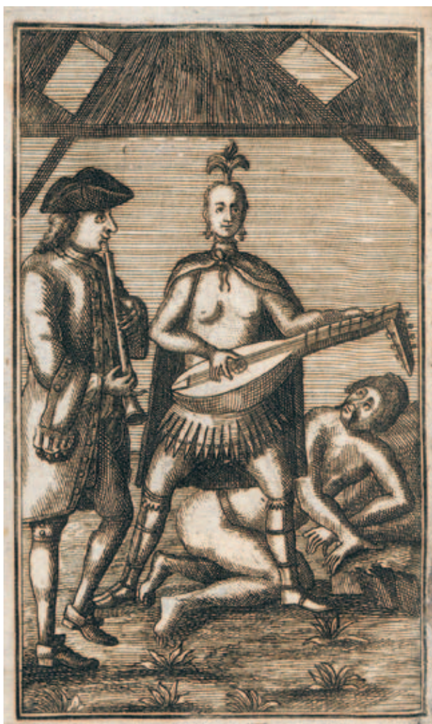
3 [Anonym]: Die Americanische Amazonin Flora aus Parana, Frankfurt 1756. Aus dem Neuzugang der SUB Göttingen

Diese Hochzeitsschrift von Martin Opitz (1597–1639) ist bisher bibliografisch ein Novum. Der Druck befindet sich in einem barocken Sammelband mit 43 weiteren seltenen Drucken, die größtenteils noch nicht im VD 17 verzeichnet waren.