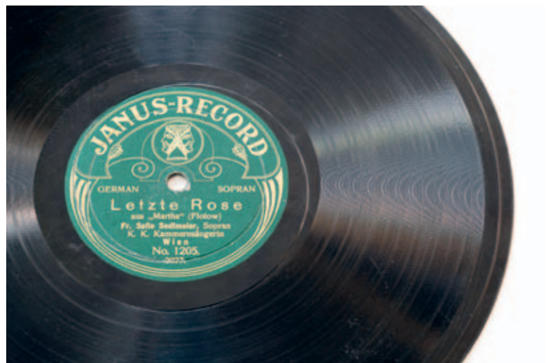
5 Schellackplatte des hannoverschen Musikverlags »Vereinigte Schallplatten-Werke Janus-Minerva«: »Letzte Rose«, Sofie Sedlmair, Aufnahme um 1910. Aus den Neuerwerbungen der DNB