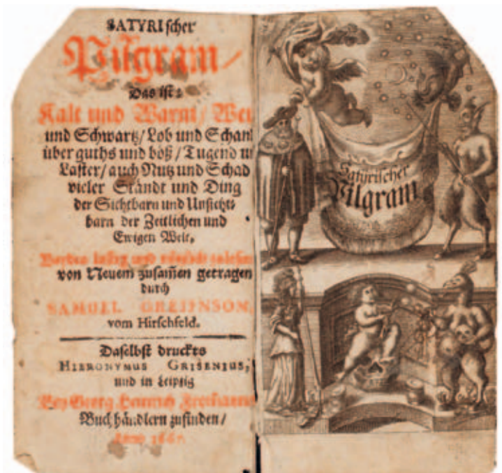
2 Hans Jakob Christoph von Grimmelshausen: Satyrischer Pilgram. Das ist: Kalt und Warm, Weiß und Schwartz, Lob und Schand [...], Leipzig 1667. Erworben von der HAB Wolfenbüttel