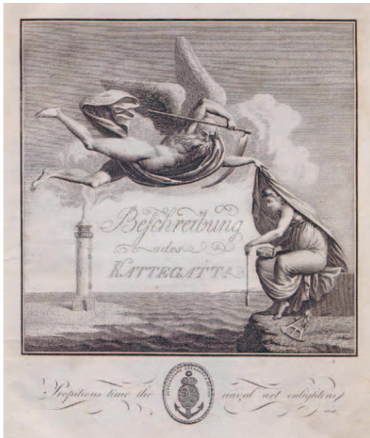
4 Poul Løvenørn: Anweisung für Seefahrende im Kattegat [...], dritte vermehrte Auflage, Kopenhagen 1806. Erworben von der UB Frankfurt