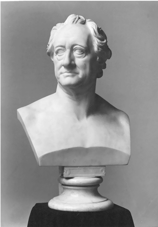
Abb. 2: Christian Daniel Rauch: Goethe. Marmorbüste (1820)

Der dritte Fall hat mit dem historischen Johann Wolfgang Goethe zu tun. Als Goethe das von dem Bildhauer Christian Daniel Rauch (1777–1857) im Jahr 1820 modellierte Original der Skulptur zu sehen bekam (Abb. 2), nahm er rezeptionstheoretisch gesehen zunächst die beiden uns inzwischen bekannten Analysen vor: Erstens Bedeutungsanalyse: ›Ja, ein Mann‹. Zweitens Referenzanalyse: ›Ach, das bin ja ich‹; sodann aber auch noch drittens eine Gleichungsanalyse – Gleichung: lateinisch ›similitudo‹ oder ›aequalitas‹ –, bei der die Frage lautet: Ist das Abbildnis auch lebensweltnah? Das heißt: Wie steht es um den Grad der Merkmalsgleichheit, zumindest den der Gestaltgleichheit? 7