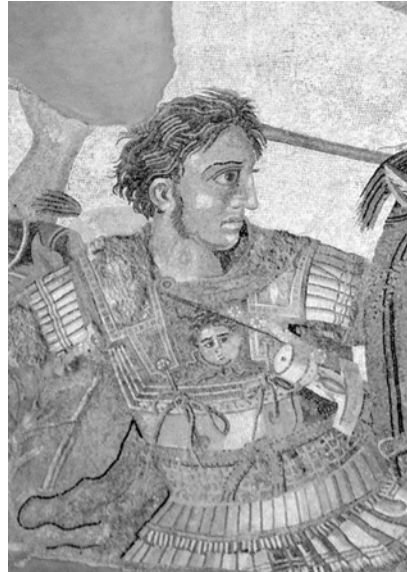
Abb. 5: Alexander der Große. Pompejanisches Mosaik (Detail)