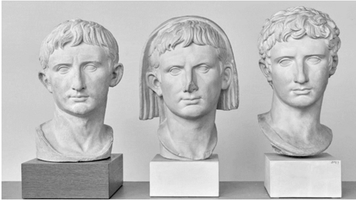
Abb. 6: Vielfältiger Augustus, Museum für Abgüsse Klassischer Bildwerke München