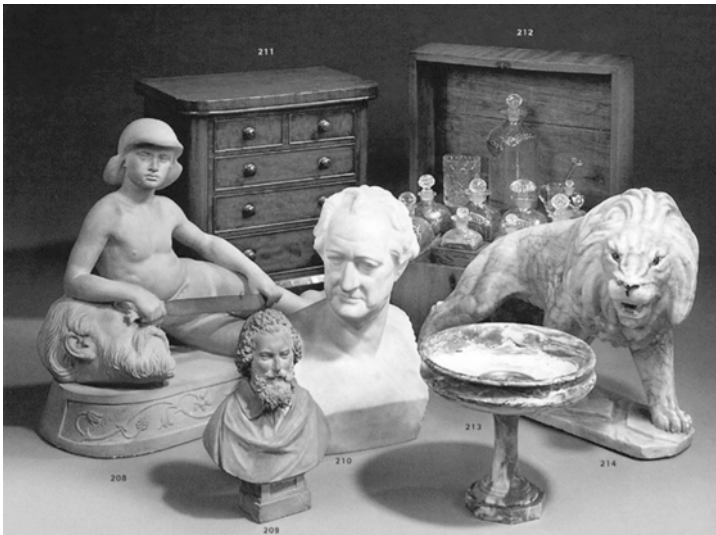
Abb. 1: Goethe-Alabasterbüste von L. J. Gallet (um 1900)

autor offenbar keine näheren Informationen hatte. Er konnte daher nur eine Zeichenbedeutungsanalyse auf Basis seines semiotischen Wissens, sprich: seines Bildwissens, des ›BildCodes‹, mit entsprechend kognitiv gespeichertem Bildzeichenlexikon vornehmen, in dem das Zeichen ›Männerkopf‹ beziehungsweise ›Herrenkopf‹ als ›type‹ vorhanden war (Abb. 1). 3 Entsprechend hieß der kommentarlose Katalogeintrag: »bust of a gentleman«, Herrenbüste. 4