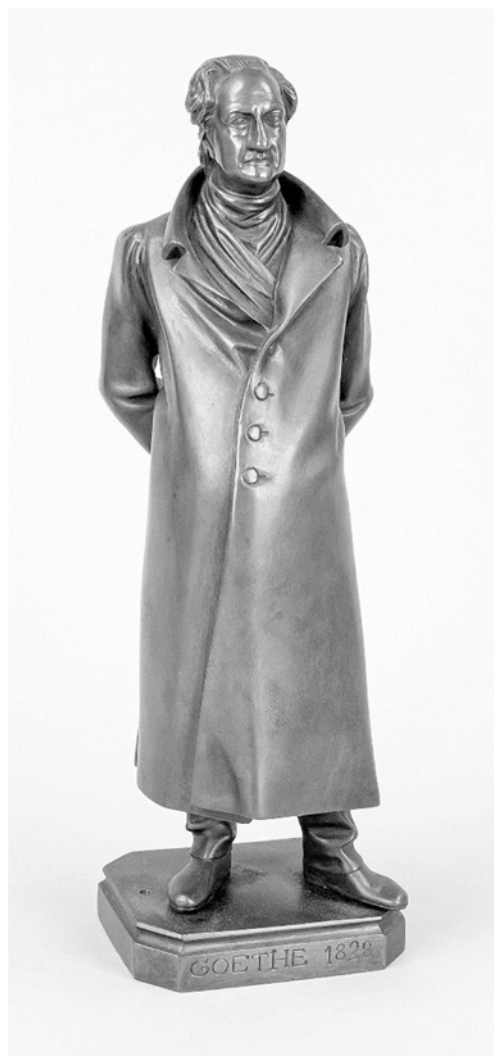
Abb. 3: Christian Daniel Rauch: Goethe im Hausrock. Kleinskulptur aus Bronze (1828)

se Haltungen ein. Diese in eine Skulptur zu überführen, gehört zu den Unmöglichkeiten beim Gleichbildnis. Denn die Strukturdetermination der klassischen Skulptur lässt als Textur nur ›stills‹ zu. Implizit hat Goethe mit seiner Bemerkung den Nagel auf den Kopf der ›stilk- Bedingung alles Bildlichen getroffen, wenn es ein Bildnis ist.