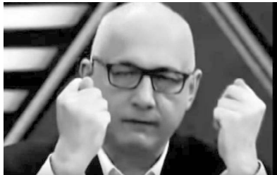
Abbildung 4: Der frühere polnische Innenminister Joachim Brudziński. 12

Die Position der polnischen Regierung war also völlig klar: Es ist kein Geld fällig, es wird kein Geld überwiesen werden und allein die Forderung stellt bereits eine Beleidigung dar. Es überrascht wenig, dass die jüdische Diaspora und Israel darauf mit Entrüstung reagierten. Zu sehr erinnert dies an den Bibelvers: »Du hast gemordet, dazu auch fremdes Erbe geraubt!« (1 Kön 21,19). 13 Denn schon bei der Verabschiedung des »Holocaust-Gesetzes« konzentrierten