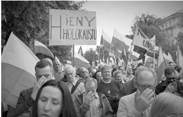
Abbildung 2: Demonstration gegen den Act of Congress S. 447 in Warschau im Jahr 2019.