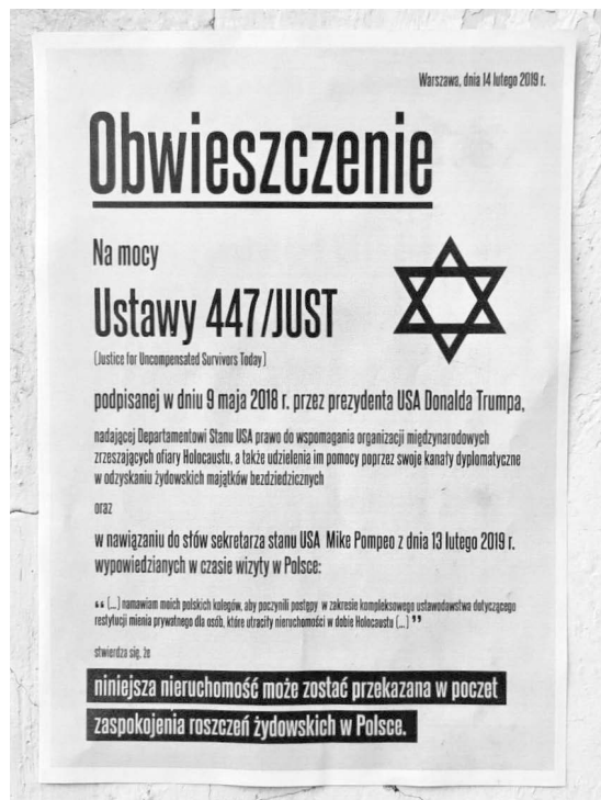
Abbildung 3: Propagandistisches Poster in Warschau mit einer Warnung vor angeblichen Rückgabeforderungen jüdischen Eigentums. 5

Im Nachkriegspolen blieb dies ein schuldbeladenes Geheimnis, das erst in diesem Jahrhundert Historiker: innen wie Jan Gross, Barbara Engelking und Jan Grabowski nach und nach ans Licht brachten. Ihre Arbeiten wurden hauptsächlich unter linken und liberalen Regierungen durchgeführt und veröffentlicht, die möglicherweise nicht sonderlich erfreut darüber waren, sich aber niemals das Recht herausnahmen, universitäre Forschung zu kommentieren, und schon gar nicht, sich in sie einzumischen. Dieses dunkle Geheimnis ist der Grund, warum 75 Jahre nach dem Ende des Krieges die »nachjüdische Frage« in Polen immer noch so lebendig ist. Beispielsweise ist im heutigen Polen eine