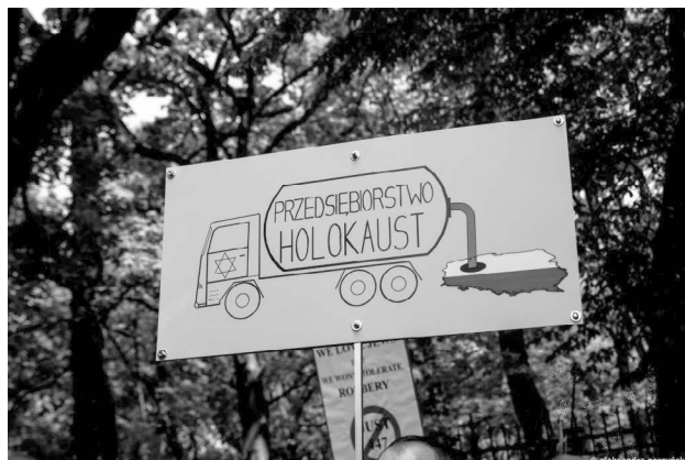
Abbildung 6: Ein antisemitisches Schild auf einem Protestmarsch in Warschau im Jahr 2019.

Diese Wahrnehmung der jüdischen Motive ebnete den Weg für weitere Lügen über jüdische Forderungen. Obwohl die Theresienstädter Erklärung über erbenlose Besitztümer wie bereits erwähnt lediglich feststellt, dass dieses Vermögen für die Hilfestellung für Überlebende und für die Bildungsarbeit zur Shoah verwendet werden kann (Serbien hat vor zwei Jahren eine Vereinbarung getroffen, 25 Jahre lang eine Million Dollar jährlich für diese Ziele zur Verfügung zu stellen, und war damit das letzte Land in einer langen Liste, die eine solche Vereinbarungen getroffen haben), sind viele Polen der Überzeugung, dass die jüdischen Kläger darauf zielen, durch Geldzahlungen oder durch analoge Sachleistungen für das ganze Vermögen kompensiert zu werden, das Juden zu Kriegsausbruch besaßen und erblos blieb. 19 Solch eine Forderung, die jeder Grundlage entbehrt und zum Staatsbankrott führen würde, wurde allerdings niemals gestellt; was jüdische Organisationen erwarten, ist eine Variante des serbischen Deals. Trotzdem gibt es die Vorstellung, dass die Juden »Polen ausaugen« wollen, immer noch, beispielsweise auf diesem Schild (Abb. 6), das einen LKW eines Unternehmens ( przedsiębiorstwo ) mit Davidstern abbildet, der Ressourcen aus Polen absaugt, ein Gedanke, der durch wiederholte Aussagen