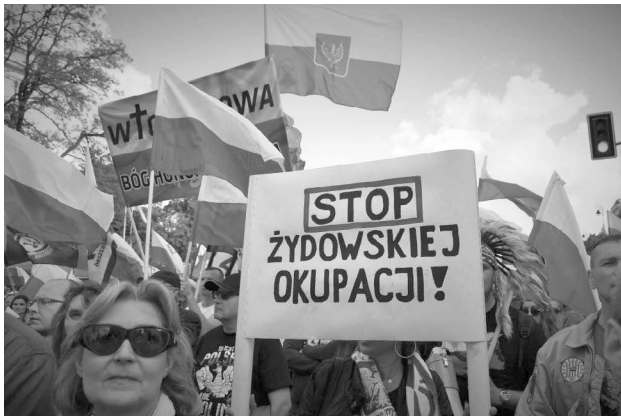
Abbildung 1: Demonstration gegen den Act of Congress S. 447 in Warschau im Jahr 2019.

Diese ehrenwerte Absichtserklärung stellte zusammen mit dem Act S. 447 für die Organisatoren der Demonstration, die der parlamentarischen und außerparlamentarischen extremen Rechten entstammten, den jüdischen Versuch dar, dem polnischen Staat unrechtmäßig 300 Milliarden Dollar abzapfen und so das Land in den Bankrott zu treiben; dagegen zu protestieren und sich dem zu widersetzen sei deswegen buchstäblich eine Frage von Leben und Tod. 3 »Stoppt den Act S. 447 – Verfassungswidrige Plünderung« heißt es auf einem hochgehaltenen Transparent, im Hintergrund erklingt die Nationalhymne.