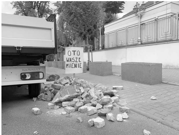
Abbildung 5: Ein Schild mit der Aufschrift »Dies ist Euer Besitz« neben einem Haufen Ziegelsteine. 18

Restitution. 17 Die rechtsextreme Organisation Allpolnische Jugend lud einen Haufen Schutt vor der israelischen Botschaft ab und steckte ein Schild hinein mit der Aufschrift »Dies ist Euer Besitz«. Es ist nur schwer vorstellbar, dass eine zukünftige Regierung von dieser Position abrücken wird.