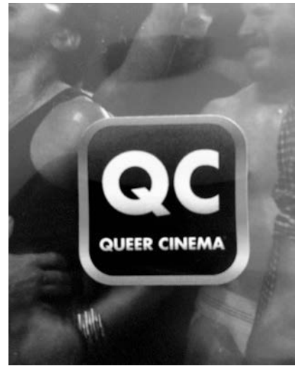
Abb. 6 DVD-Hülle von Interior. Leather Bar

Filmproduktionshistoriografie könnte bedeuten, eine lineare und zielgerichtete Entwicklung, Vorbereitung und Durchführung eines Filmprojekts nachzuzeichnen. Zentral bliebe darin der Fokus auf ein bestehendes Werk, dessen Hervorbringung, womöglich hagiografisch, rekonstruiert würde. Mit der produktionshistorischen Skizze zu Cruising ist ein alternatives Verfahren angezeigt, das auf eine epistemologische Verschiebung der Perspektive auf Film als Gegenstand deutet. Mit dem Fokus auf Produktion kann Filmgeschichte anders dargestellt werden; Produktionshistoriografie eröffnet die Möglichkeit, um mit Vonderau zu sprechen, Film als «work in progress» zu verstehen» und «die Idee eines autoritativen Originals» zu verwerfen. 38 Dass die Geschichte zu Cruising von Störungen und Eingriffen, von Zensur und Zerstörung erzählt, zeigt die Arbitrarität des Herstellungsprozesses markant auf, ist aber nur offensichtliches