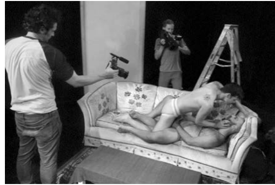
Abb. 4–5 Screenshots aus: Interior. Leather Bar. , Regie: James Franco, Travis Mathews, USA 2012

ein gravierendes Problem auf: Sie präsentieren allermeist die Erzählung eines fertigen und vollendeten Produkts. In Opposition hierzu steht etwa das film-historiografische Verfahren Sylvie Lindepergs: 21 Filmproduktion wird dort als Palimpsest gedacht – als ein nicht nur immer wieder neu beschreibbarer (das heißt: interpretierbarer), sondern auch als ein immer wieder erneut überschriebener (das heißt: veränderlicher) Text. 22