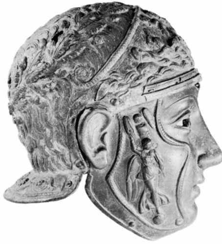
Abb. 3: Römischer Maskenhelm aus einem thrakischen Grabhügel bei Vize, Istanbul, Archäologisches Museum 5730

Ein grundsätzlicher Unterschied zu den Helmen der teils ebenfalls berittenen Gladiatoren liegt in der Gestaltung des Visiers. Frei nach Dumas waren die Kavalleristen Männer mit eisernen Masken, die eine stabile Schutzschicht in anthropomorpher Form vor den eigentlichen Gesichtern aus Fleisch und Blut bildeten (Abb. 3). Auf den ersten Blick erscheinen die Reitersoldaten mit diesen anthropomorphen Masken weniger gesichtslos als die Gladiatoren hinter ihren anonymen Visierhelmen. Obwohl im Gegensatz zu den wenigen berühmt gewordenen Gladiatoren kaum ein Soldat namentlichen Einzug in Schriften der lateinischen Autoren fand, zeigen die erhaltenen Grabsteine der verstorbenen Kavalleristen ein persönlicheres Bild. Tragen die Grabsteine eine Inschrift, erfahren wir in der Regel den echten Namen des Verstorbenen und keine selbstgewählte Bühnenidentität. Darüber hinaus erzählen die Epitaphe bisweilen von der Herkunft, der Truppenangehörigkeit und manchmal auch von den Vätern, Frauen und Kindern der Soldaten. 11 In den großen Bildfeldern der Grabmäler sehen wir zumeist schwerk gepanzerte, mit langen Lanzen und Schwertern bewaffnete Reiter auf galoppierenden Pferden, unter denen ein unterlegener Gegner liegt (Abb. 4). Der genaue Blick auf die Bilder der bekannten Reitergrabsteine zeigt jedoch, dass die Soldaten in einem gezielt durchkomponierten, höchst standardisierten Bildschema dargestellt sind. 12