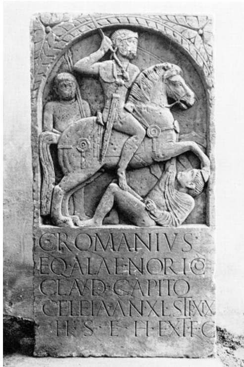
Abb. 4: Frühkaiserzeitlicher Reitergrabstein des Romanus, Mainz, Landesmuseum S 607

Die Reliefs betonen Ausrüstung und Bewaffnung, indem sie diese unproportional groß darstellen. Gleichzeitig scheinen die Attribute trotz des starren Bildschemas erstaunlich realitätsnah wiedergegeben zu sein; sie lassen sich von den Schmuckscheiben der Pferde über die Langschwerter bis hin zu den Kettenhemden und Helmen gut mit erhaltenen, tatsächlichen Gegenständen vergleichen. 13