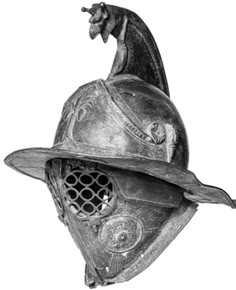
Abb. 2: Helm eines Thraex aus der Gladiatorenkaserne von Pompeji, Neapel, Archäologisches Nationalmuseum 5649

Die Gesichter verschwanden nun vollständig hinter einer bronzenen Schutzschicht; für die Augen blieben nur kleine Löcher, die oft zusätzlich mit metallenen Gittern versehen waren (Abb. 2). Die Helme drückten mit ihrem Gewicht von durchschnittlich drei bis fünf Kilogramm schwer auf die Nacken der Gladiatoren, behinderten die Sicht auf den Gegner und erschwerten das Atmen während der schweißtreibenden Kämpfe. 3 Dennoch bildeten sie eine lebensnotwendige Barriere zwischen den scharfen Waffen des Kontrahenten und dem eigenen Kopf.