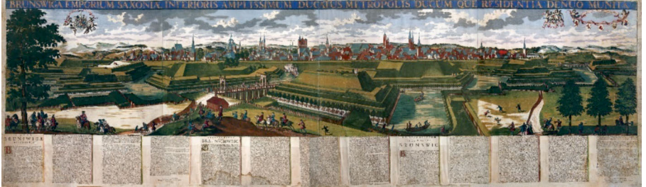
Abbildung 1: Ansicht der Stadt Braunschweig 1723, Städtisches Museum Braunschweig. Die großformatige Ansicht war als Werbung für die Braunschweiger Messen gedacht und hat eine mehrsprachige Legende.

Quelle: Städtisches Museum Braunschweig; vgl. [Mertens, Jürgen]: Ansicht der Stadt Braunschweig von Osten, um 1723, in: ders.: Die neuere Geschichte der Stadt Braunschweig in Karten, Plänen und Ansichten, Braunschweig 1981, S. 107–112, Blatt 26.