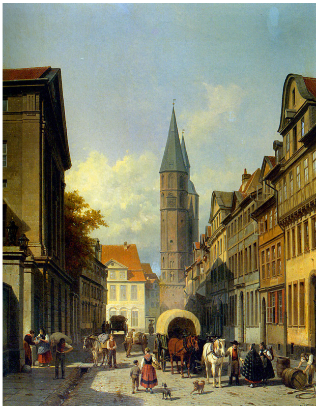
Abbildung 3: Der Bohlweg nach Norden. Gemälde von Jacques Carabian (1834–1933). Auf der linken Bildhälfte ist zunächst das Zeughaus und im weiteren Verlauf das Collegium Carolinum erkennbar. Den Abschluss bildeten die Südfassade des Opernhauses auf dem Hagenmarkt und die Türme der benachbarten Katharinenkirche.