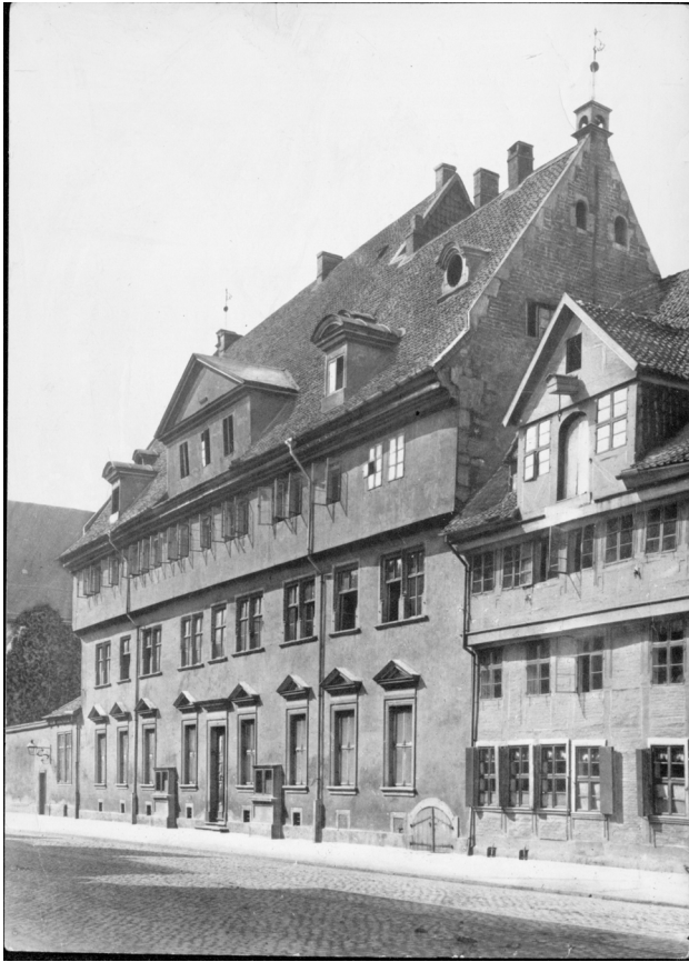
Abb. 4: Das Gebäude des Collegium Carolinum um 1890. Im Erdgeschoss, links neben dem Eingang befand sich die Bibliothek.