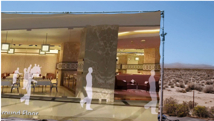
Abb. 3: Hito Steyerl – How Not to Be Seen: A Fucking Didactic Educational .MOV File

Die Geschichte der gated community setzt sich in der fünften Lektion fort, aber nicht als Einbruch, sondern als Ausbruch aus dessen Umgrenzung. Spielort ist das resolution target in der kalifornischen Wüste, auf dem nun der Green Screen zu sehen ist. Die grünlichen Darsteller*innen tauchen wieder auf, tanzen und streifen ihre Umhänge ab, um darunter grüne Ganzkörperanzüge zu zeigen, die sie gleichfalls halbtransparent erscheinen lassen. Auf dem Green Screen sieht man wieder die 3D-Animation, diesmal inklusive eines Auftritts von The Three Degrees, die When Will I See You Again (1974) singen. Aus der Animation lösen sich erst milchige Vögel und schließlich die geisterhaften Stellvertreter*innen und gehen in die dokumentarischen Bilder des resolution targets über. Selbst die Stellvertreter*innen sind damit nicht mehr an die Animation und die Grenzen der gated community gebunden. Dieser Übertritt ist auch eine Vervielfältigung, wie sich in dem Moment zeigt, in dem sich eine der geisterhaften Figuren plötzlich verdoppelt, den Schritt beschleunigt und aus dem Screen in die Wüste statt ins Off tritt. Der Austritt ist Teil einer unkontrollierbaren Zirkulation, in dem sich verschiedene Arten von Bildern überlagern. Gerade der Ort einer Stabilisierung, das resolution target in der kalifornischen Wüste, wird somit zum Austragungsort dieser zunehmenden Übertretung, in der