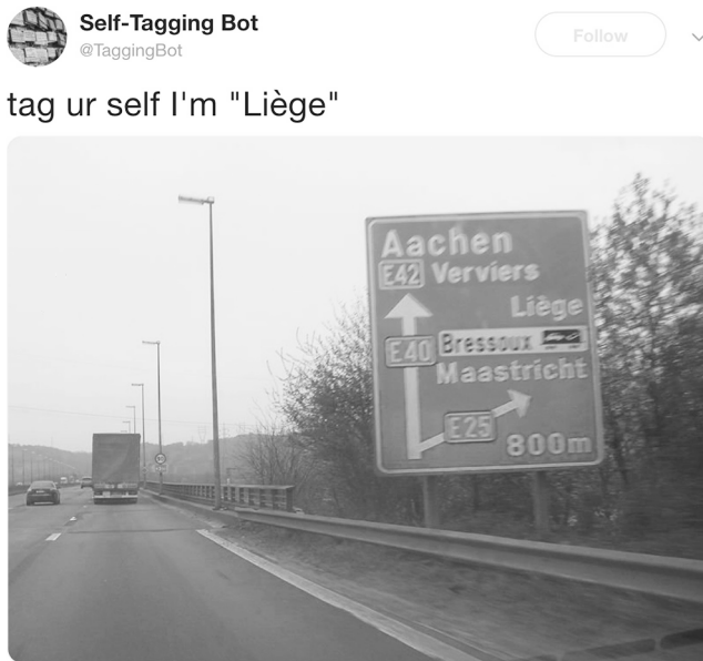
Abb. 6: Screen Capture (Jim Kang – Self-Tagging Bot [2018])

image becomes less of a representation than a proxy, a mercenary of appearance, a floating texture-surface-commodity. Persons are montaged, dubbed, assembled, incorporated. 259