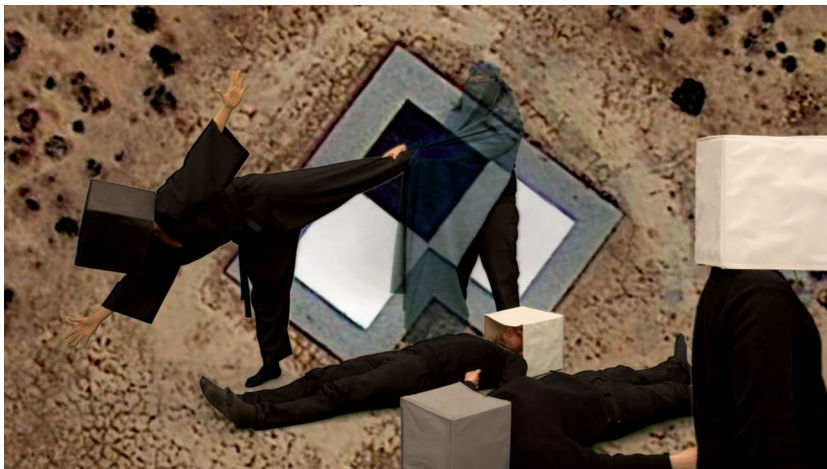
Abb. 2: Hito Steyerl – How Not to Be Seen: A Fucking Didactic Educational .MOV File

2013, HD video, single screen in architectural environment, 15 minutes, 52 seconds