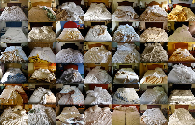
Abb. 5: Hasan Elahi – Stay

2011, Courtesy of the artist and C. Grimaldis Gallery