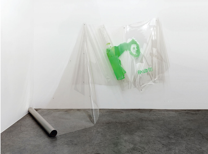
Abb. 4: Seth Price – Hostage Video Still with Time Stamp

2005, Eyelets, plastic inks, archival mylar film, Dimensions variable (SPR 05/001), Courtesy of the artist and Petzel, New York