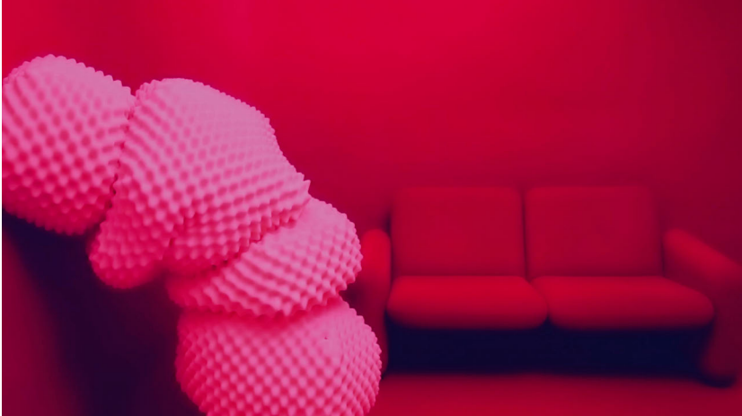
Abb. 7: Katherine Behar – »Clicks« (frame from video) from Modeling Big Data

2014, Six-channel HD video installation, color, sound. Endless loops.