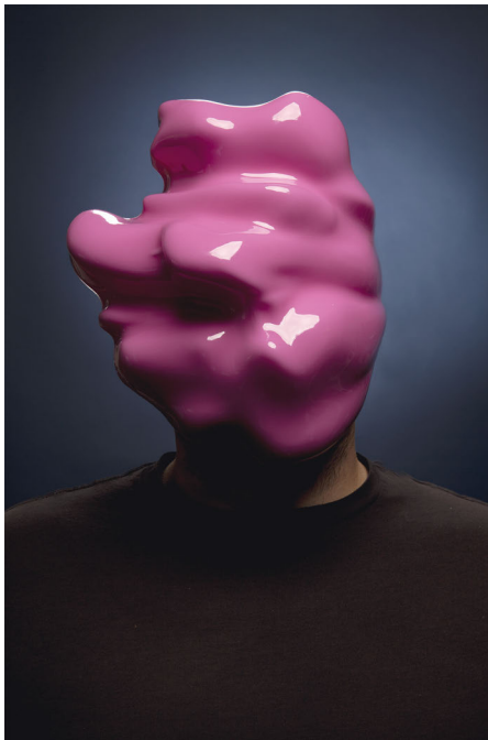
Abb. 8: Zach Blas – Facial Weaponization Suite: Fog Face Mask

October 20, 2012, Los Angeles, CA, 2012