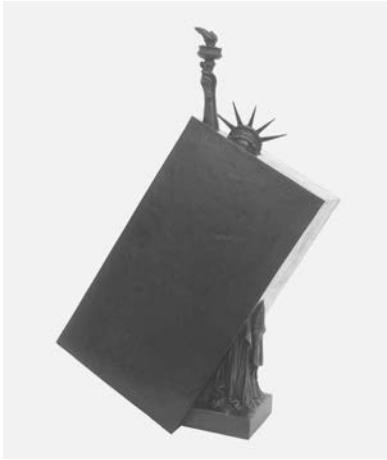
Abb. 1: Sacha Sosno, Liberté penchée , 1986, Bronze, 49,5 × 35 × 15 cm, Foto: Adam Rzepka, © VG Bild-Kunst, Bonn 2024.