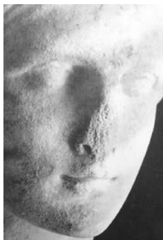
Abb. 1: Kopf einer Frauenstatue, Ostgriechisch, 300/280 v. Chr., Marmor, Höhe 30 cm, München Glyptothek.