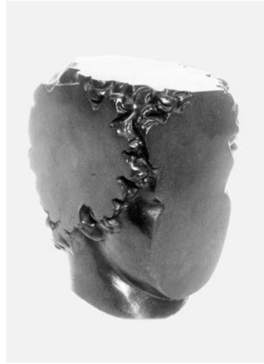
Abb. 4: Sacha Sosno, Je vois tout , 1984, Bronze, 23,6 cm, Foto: Adam Rzepka, © VG Bild-Kunst, Bonn 2024.

Vielleicht ist es einfach die Zurückweisung, es dabei bewenden zu lassen, sich endgültig dem ‚Es gibt‘ zu beugen, dem, was Levinas die Schwere des Seins und die Leichtfertigkeiten sogar des Schönen nannte. Diese Art der Zurückweisung wäre vielleicht Schaffung eines Mangels, wo der Mangel zu fehlen schien. Was diese Zurückweisung mit sich bringt, ist nicht nur das Erwachen in eine andere Zukunft, sondern auch eine Erinnerung, die mit der Angst vor dem Verschwinden verbunden ist. Die Zurückweisung kommt, um die Unruhe, die Unstillbarkeit wiederherzustellen. Die Zurückweisung des bereits Vorhandenen lenkt uns auf das ‚noch nicht Vorhandene‘. Die Zurückweisung, sich mit dem Selben zu begnügen, lenkt unser Verlangen nach dem Anderen.