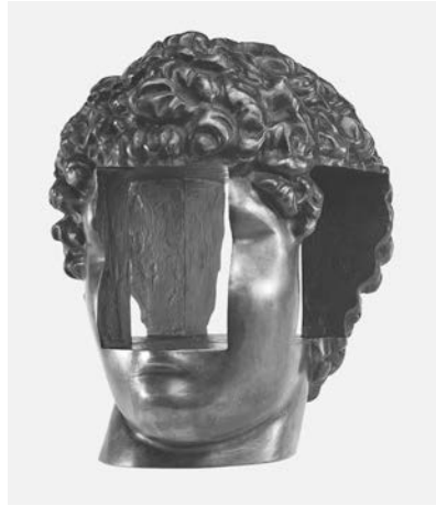
Abb. 2: Sacha Sosno, Tête aux quatre vents , 1980, Bronze, 26 × 21 × 23,5 cm, Privatbesitz, Foto: © François Fernandez.