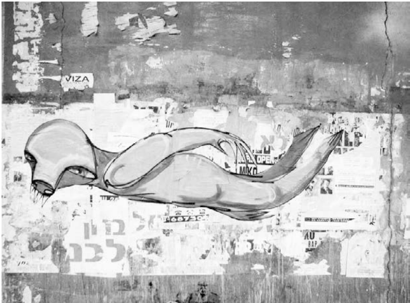
Abb. 2: Klone , Tel Aviv, 2008.