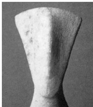
Abb. 2: Idole féminine, Style cycladique (2500-2200 v. Chr.) (Ausschnitt), Paris, Musée de Louvre