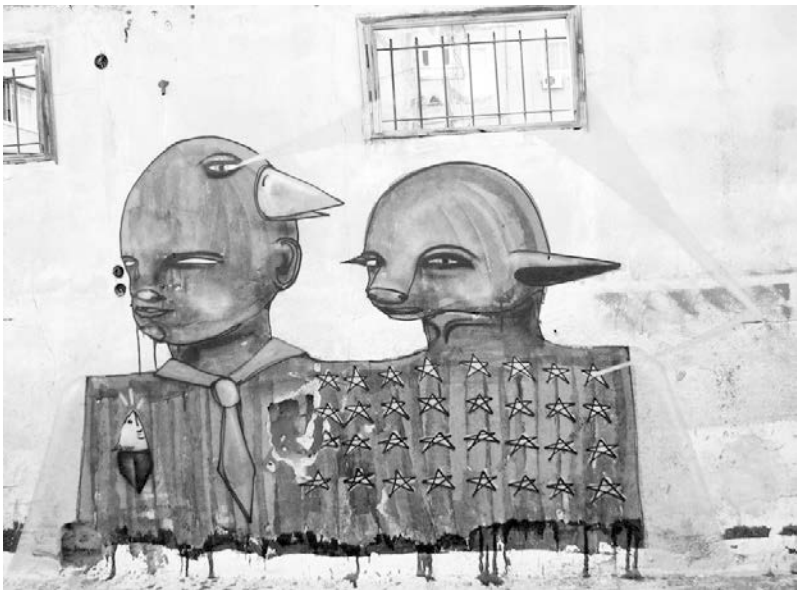
Abb. 3: Klone , Tel Aviv, 2008.