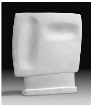
Abb. 3: Alberto Giacometti, Tête qui regard, 1928-1929, Marmor, 41×37×8 cm, Alberto Giacometti-Stiftung, Zürich