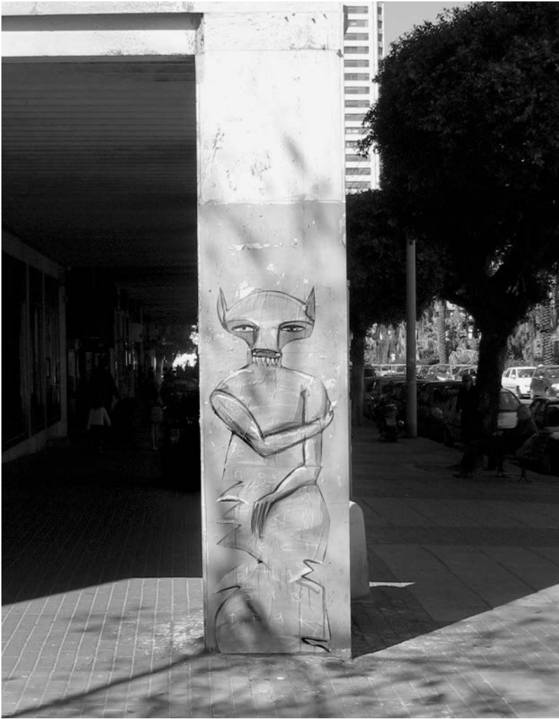
Abb. 1: Klone , Tel Aviv, 2008.