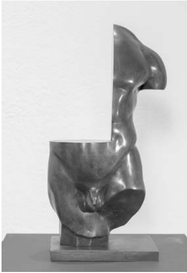
Abb. 3: Sacha Sosno, Coupe, Coupe, s'il a des défauts, il s'en défait , 1979, Bronze, 51 × 24 cm, Foto: © Jean-Claude Fraicher.