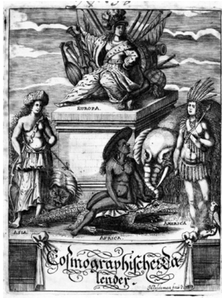
Abbildung 6: Die vier Erdteile – Kupferstich von Sigmund Gabriel Hipschmann nach einer Vorlage von Joachim Sandrart (Frontispiz aus Stöffler 1673).

Hatte dieser ›europorische‹ Kalender noch alle Teile der Welt berücksichtigt, gesellte sich ihm 1675 der bereits zitierte Americanische Schiff-fahrten/Sitten-/Trachten-/Grausamkeiten- und Landschafften-Calendar hinzu, der mindestens bis 1678 bestand. Während sein Frontispiz – zwei ›Indianer‹ halten ein Bildnis Karls V., im Hintergrund sind gegen Hunde kämpfende ›Wilde‹ zu sehen 16 – wie im Vorläufer von dem Nürnberger Kupferstecher Sigmund Gabriel Hipschmann stammt, ist die Autorschaft bzw. die Redaktion des amerikanischen Ablegers ungewiss. Sicher ein Pseudonym ist der Name »Coran Itzapolka / geborne[r] Americaner, aus Quito«, der auf dem Titelblatt des ersten Jahrgangs erscheint und mit dem noch die Vorrede des zweiten Jahrgangs unterzeichnet ist. Wahrscheinlich steht er für den seit dem zweiten Jahrgang angegebenen Astrologen