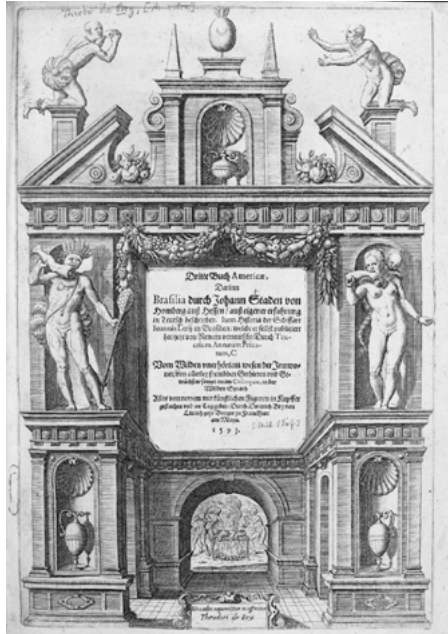
Abbildung 3: Kupferstich von Theodor de Bry (Frontispiz aus Staden/Léry 1593).

werden beim Verspeisen menschlicher Körperteile gezeigt – und dabei selbst von einem Dämon angefallen. Zugleich aber integriert de Bry sie in die Blendnisse eines europäischen Architekturensembles, wo sie die Position antiker Statuen in Aedikulae einnehmen. Die Voluten, das Muschelwerk, die Ziervasen und die Floralarrangements sind zwar keine klassizistischen Ornamente, entsprechen aber dem ästhetischen Geschmack der Zeit und heben die Alterität brasilianischer Sitten umso stärker hervor. Die zivilisatorische Norm, die in der antithetischen Ordnung der vertrauten Bauelemente zum Ausdruck kommt, unterstreicht somit das transgressive Moment der amerikanischen Anthropophagie. Das kontrastive Zurschaustellen von Alterität ist aber nur ein Aspekt des Frontispizes. In der Haltung erinnern die beiden Kannibalen nämlich an Adam-und-Eva-Darstellungen, etwa auf Dürers bekanntem Kupferstich von 1504 (Abb. 4 und 5) – wie dort steht der amerikanische Mann zur Linken, die Frau zur Rechten; beide wenden den Kopf einander, den Oberkörper dem Betrachter zu; beide sind in Kontrapoststellung mit gespiegeltem Spielbein und geöffneten Armen dargestellt. Mit etwas Phantasie entspricht der Schlange auf Dürers Stich der schlangengeschwänzte Dämon, der sich bei de Bry um die Tupinambáfrau windet.