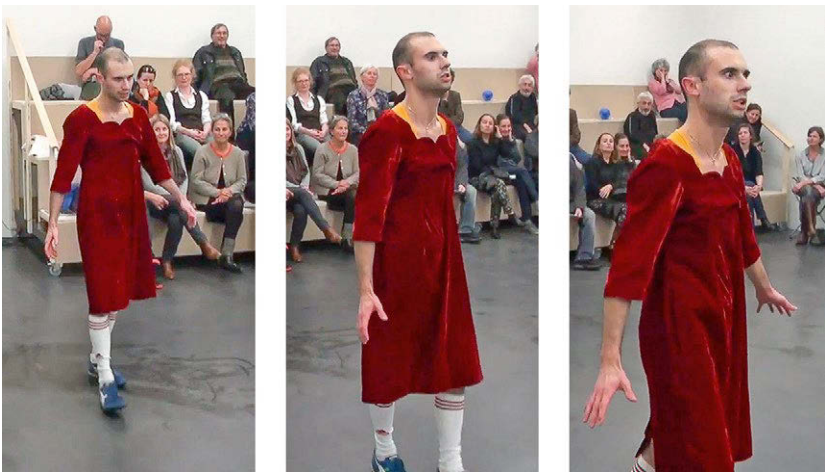
Abbildung 15: ‚Abgang‘ als Carrie

Es gibt Andeutungen, dass auch den Zuschauer:innen etwas Unheimliches passieren könnte, ähnlich dem oder anders als das, was Wicht geschah. Der Performer geht erst mit zunehmendem und schließlich in der Szene ‚Angriff‘ mit vollem Körpereinsatz gegen sich selbst vor, während er den Angreifer darum anfleht, damit aufzuhören; dann beschuldigt er das Publikum, ihn anzugreifen, und droht ihm zuletzt mit dem Tod. Was könnte passieren? Ein Schlag, ein Übergriff, ein plötzliches Nahekommen, eine überraschende Berührung, ein verletztes Sicherheitsgefühl? Angegriffene Überzeugungen? Könnte das Wissen darum verloren gehen, nicht belangt zu werden, weil ich zu den Guten gehöre, nichts getan habe? Die Teilnehmenden sind gemeinsam in die Falle gelockt, aber könnten jederzeit weggehen, und es gibt keine sichtbaren Panikreaktionen anderer Anwesender auf den plötzlich abgedunkelten Raum. Als Teilnehmende behalte ich im Blick, dass die beiden Durchgänge, die in die angrenzenden Ausstellungsräume führen, offenbleiben, sodass der Raum nicht zur Falle wird und ich ihn, wenn ich gehen wollte, verlassen könnte. Immerhin löst sich die Befürchtung, dass etwas passieren könnte, was mich als Teilnehmende wirklich körperlich anrührt oder affiziert, nicht ein.