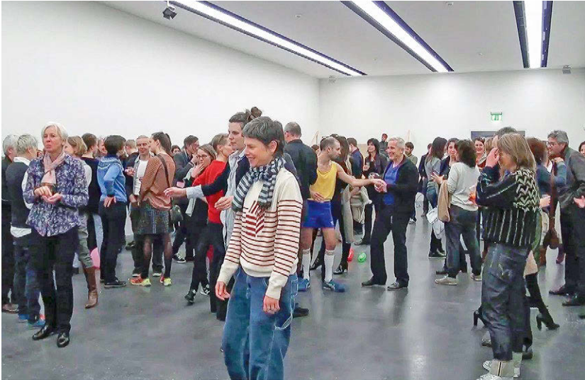
Abbildung 8: ‚Having a ball?‘ Herumstehende Teilnehmer:innen von Prom

warten ab. Die Stimmung sinkt, denn insgesamt ist die Szene eher enttäuschend. Nur wenige, die die Bezugnahme des Stückes auf die literarische Vorlage Carrie bereits durchschaut haben, mögen im ‚Fest‘ die Szene im Ballsaal erkennen, die ursprünglich in der Katastrophe endet und einen anderen möglichen Fortgang – hin zum in Carrie angelegten Rachemotiv – erahnen. Doch dazu gibt es kaum einen Anhaltspunkt. Die Situation ‚Fest‘ zeichnet sich eher durch ihre Differenz zu einem Fest insgesamt aus.