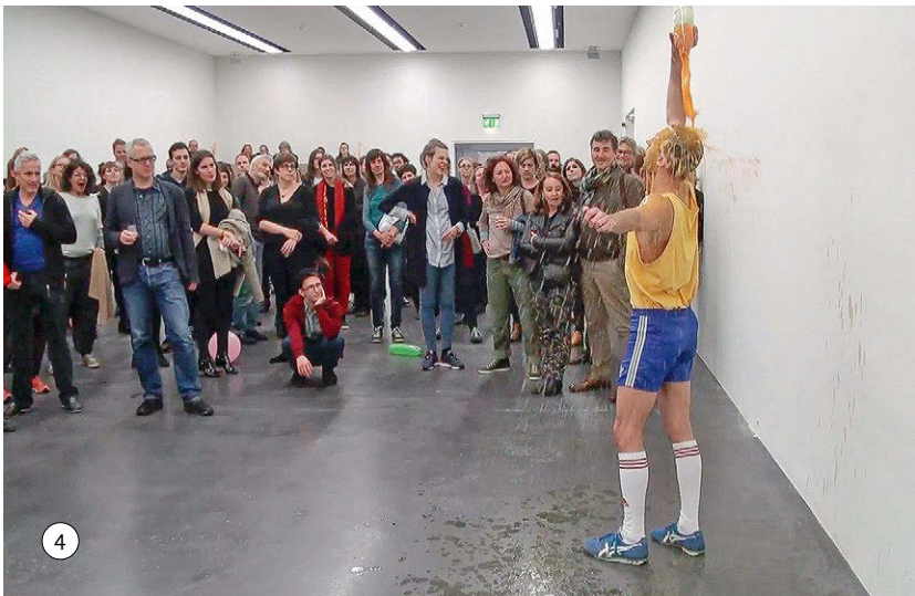
Abbildungen 19/20: Publikumsbildung in Bild 3 und Bild 4

Im dritten Bild werden positive Reaktionen auf Wicht und auf die Inhalte der Erzählung sichtbar. Das Publikum zeigt sich aufmerksam und sogar gut unterhalten, manche lachen. Sichtbar wird damit eine Ausrichtung auf die Geschichte – und auf ihren Erzähler –, die einerseits körperlich (Ausrichtung) und kognitiv (Aufmerksamkeit) ist, andererseits ist auch zu vermuten, dass hier eine emotionale