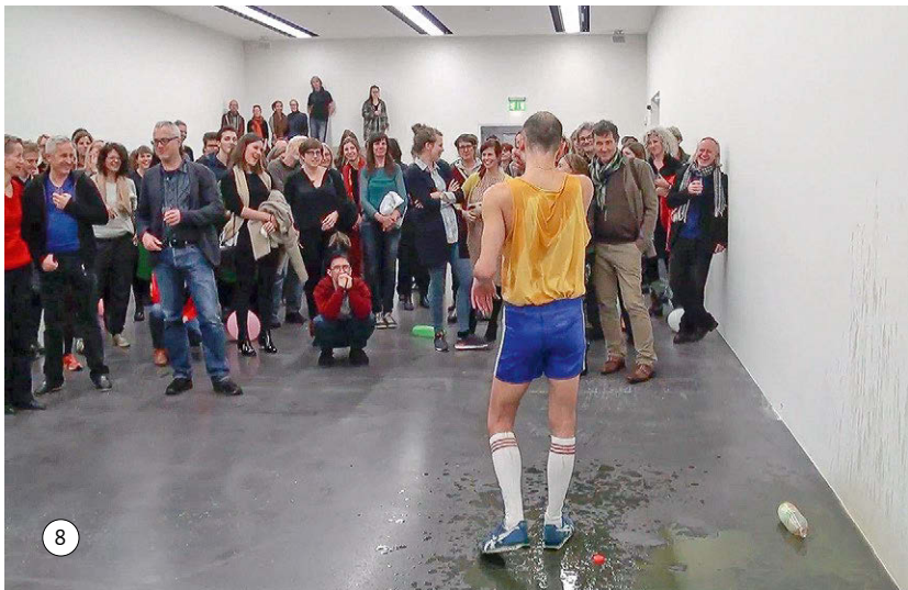
Abbildungen 25/26: Die Szene ‚Saft‘ zu Beginn und am Ende: Bild 1 und 8 im Vergleich

Die ganze Szene ‚Saft‘ lässt sich als kollektive ästhetische Situation im Miniaturformat begreifen, und sie hat durch das gemeinsam Erlebte die geteilte Ausrichtung auf die Situation verstärkt. Was zwischen dem Beginn und dem Ende der Szene vor sich gegangen ist, hier repräsentiert durch das erste und das letzte der