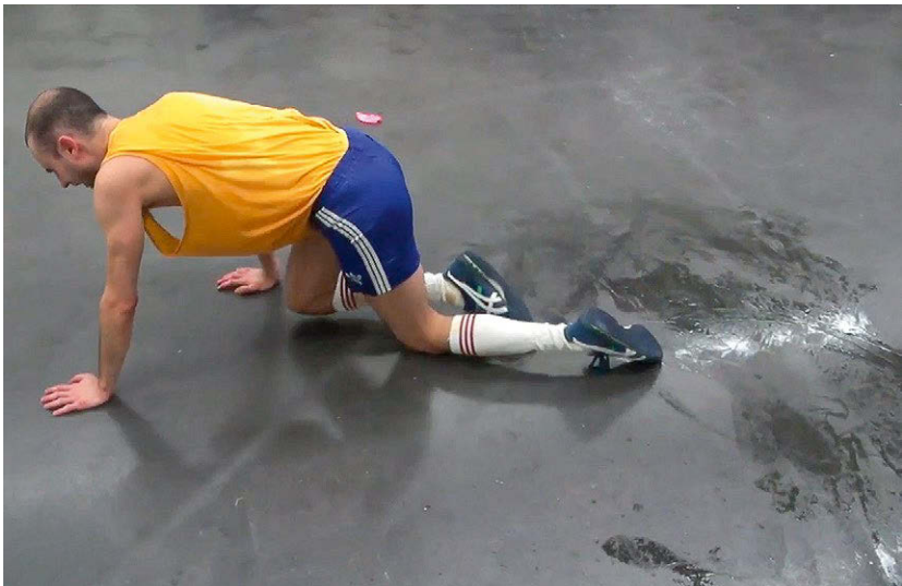
Abbildung 14: Angegriffen: Wicht kriecht zum Ausgang

ambivalent und brüchig – schließlich verwickeln sie das individuelle Erfahrungssubjekt von Prom in vage Stimmungen und negative Gefühle, die jederzeit dazu führen könnten, selbst die Situation zu verlassen. Die Beunruhigung in der Szene ‚Angriff‘ etwa stellt in ihrem Fokus auf den Selbstschutz des (In)Dividuums oder sogar des Subjekts nicht notwendig einen Ausdruck für dessen Verwicklung mit der Performer-Figur dar. Sie stellt jedoch ein Anzeichen für das bereits angebaute vorherige Vertrauen in die Gültigkeit der Situation dar. Gegenüber diesem ersten Moment lese ich die Enttäuschung, die sich in der Szene ‚Abgang‘ zeigt, als ein Symptom für die bereits geschehene Verwicklung. Beim ‚Angriff‘, der Wicht trifft, überwiegt bei mir die Beunruhigung darüber, dass möglicherweise etwas passieren wird, das auch mich körperlich angehen könnte, gegenüber einer eventuellen Sorge um Wicht. Die Erkenntnis, dass diese mögliche Gefahr, echt oder eingebildet, für Wicht oder auch für mich einen affektiven und körperlichen Vorgang darstellt, spielt eine Rolle als Grundstimmung für die weitere Analyse, wenn sie auch nicht den alleinigen Fokus darstellt. An Prom lassen sich solche Momente oder Bildungen erst mit einigem Abstand gut nachzeichnen, und gemeinsam ergeben sie ein Bild von der Stimmung, die den Erfahrungsprozess durchzieht. Beispiele einer solchen Lesart von Performance hat Katharina Pewny auf Basis existenzphilosophischer Überlegungen beschrieben. 54