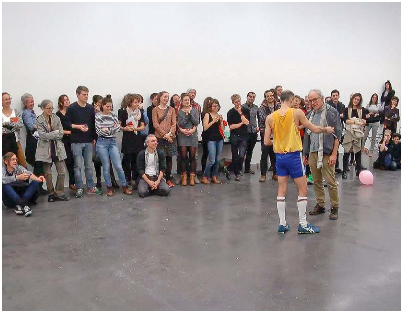
Abbildung 10: Alle dabei in ‚Telekinese‘

In ‚Telekinese‘, der dritten und längsten der drei Szenen, initiiert Wicht eine interaktive Situation, die sich um die Weitergabe von Kenntnissen der Telekinese dreht. Wicht tritt hierin nun als Lehrer auf und weihet einen Freiwilligen aus dem Publikum in seine „paranormalen Fähigkeiten“ ein, als ein Können, das seiner Aussage nach mit etwas Talent leicht zu meistern sei. Dem Schüler legt er dar, dass