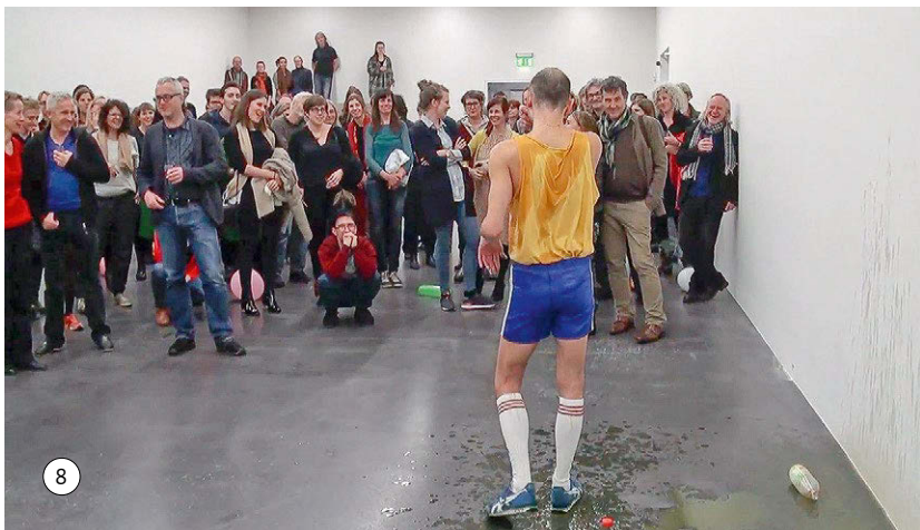
Abbildungen 23/24: Publikumsbildung in Bild 7 und Bild 8

Das siebte Bild in der Reihe dokumentiert einen weiteren Bruch, der die Geschichte erneut verändert und dramatisiert. Wicht hat die Arme gesenkt und beginnt nun einen sich in der Lautstärke steigernden Klagelaut auszustoßen, statt weiter zu erzählen und die Geschichte auf eine versöhnliche Weise abzuschließen. Im siebten Bild ist sichtbar, dass ihm jetzt alle wieder in unbewegter Haltung zugewandt sind, einander darin ähnlich, dass ihre Bewegungen mit dem Beginn des Schreis wie eingefroren wirken. Die Mienen zeigen verschiedene Nuancen zwischen