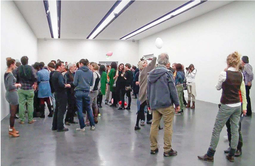
Abbildung 29: Banal: Das Fest und alle, die daran teilnehmen

Altieri, werden Menschen nicht durch Eindrücke (sensations) alleine, sondern weil sie den Affekt direkt in ein Erleben umsetzen – und dabei belegen sie die kollektive ästhetische Situation in der Vorstellung (imaginative dimension) mit Wert und knüpfen weitere, eigene Vorstellungen daran. 18 So wird aus der sinnlichen Wahrnehmung ein Angebot dafür, das Gesehene mit Gefühl und Bedeutung zu belegen, und so entsteht die Erfahrung der eigenen Bewegtheit.