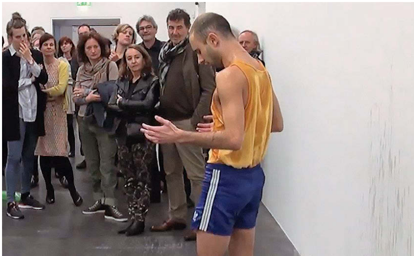
Abbildung 11: Wicht allein in ‚Saft‘