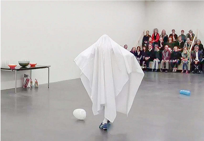
Abbildung 5: Wicht als Gespenst

Gelächter entsteht, als der Performer mit einer dramatisch übersteigerten Geste das Laken abwirft, während die Musik zugleich in einen elektronischen Theaterdonner übergeht. Ein Gewitter erklingt, das Assoziationen aus der Populärkultur aufruft: Es könnte aus It's Raining Men von den Weather Girls gesampelt sein oder auch aus einem Musical stammen. Der Donner klingt ab, aber Wichts Arm bleibt in einer Art Disco-Pose angehoben. Dabei kommt nun die Figur zum Vorschein: Die sichtbar gewordene Gestalt ist klein, aber sehnig, steckt in farbenfroher Sportbekleidung, in einem gelben Basketballtrikot und in blauen Shorts, und durch die Farbkombination wirkt sie fröhlich und unverdächtig. Es ist ein jugendlicher Sportler, wie es Tausende geben mag. Kein Geist, kein Kind, kein Monster, kein Dracula.