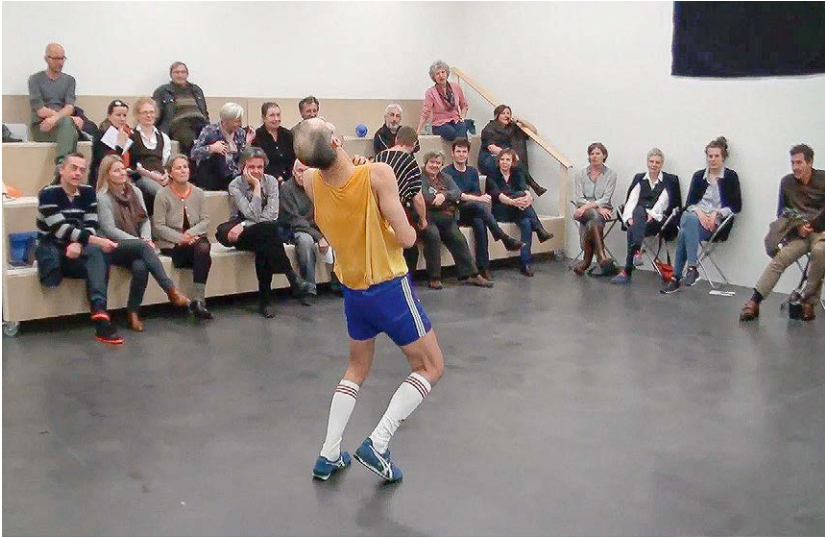
Abbildung 12: Angegriffen wovon?

sind angespannt und die Augen sind verdreht. Der Blick ist nicht auf Einzelne gerichtet, sondern auf alle. Er soll wohl böse oder mächtig wirken, verfehlt diese Wirkung aber. Nachträglich erscheint es klarer als in dem Moment selbst, dass Wicht versucht, sein Publikum symbolisch zu töten. Es erscheint als letzte Konsequenz dessen, daran gescheitert zu sein, dass dies ein Fest sein sollte, das man gemeinsam feiert. Natürlich fällt dabei niemand tot um. Es bleibt bei der Drohung. Wichts Vorführung von Besessenheit oder paranormaler Macht wird von Special Effects unterstützt: Es gibt, nachträglich betrachtet, offensichtlich eine Person, die an den Lichtschaltern dreht, was die Saalbeleuchtung flackern lässt und sie mitunter für Sekunden ganz ausschaltet, und eine andere Person rumpelt im nahen Museumsaufzug herum, sodass die Geräusche durch den Raum hallen, während sich die elektronische Musik vom Laptop ins Monumental-Dramatische steigert. Die Spezialeffekte legen humoristisch eine Distanzierung nahe, legen sie doch das Spektakel offen. Doch sie schaffen in dem Moment einen tatsächlich bedrohlichen Raum, verdunkelt, stroboskopisch erhellt, in dem es naheliegt, sich zu fragen, wie weit es zum Ausgang ist.