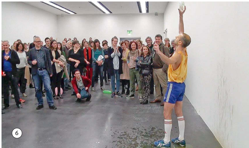
Abbildungen 21/22: Publikumsbildung in Bild 5 und Bild 6

hineinlachen und die beiden Personen, die vorne in der Mitte stehen, sich einander lachend zuwenden und die Szene offensichtlich kommentieren. Insgesamt deutet das alles auf eine gelöste Stimmung hin. Dass das Publikum von Prom Applaus spendet und lacht, weist darauf hin, dass sie das, was da für sie aufgeführt wird, als Teil ihrer Situation einschätzen. Die erzählte Situation, die erste Prom Night – die Vorgängersituation –, ist in Wichts Worten immerhin eine Tragödie gewesen, und sie ist der Grund, dass das jetzige Fest stattfindet, das ihm eine gute Erinnerung machen soll. Das Publikum steuert, obwohl – oder weil – nicht geklärt ist, was das alles soll, bereits auf einen Abschluss zu.