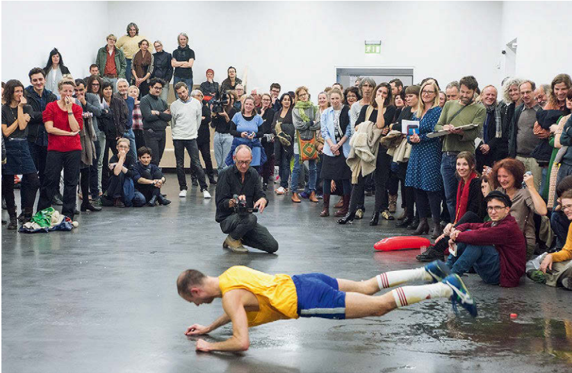
Abbildung 1: Philippe Wicht: Prom , Performance, Performancepreis Schweiz, Oktober 2015

sein des Publikums an Live-Anlässen in der heutigen medialisierten Kultur 16 stellen Referenzen dar. Doch kunstwissenschaftliche Ansätze werden der geschilderten Vielfältigkeit einer kollektiven ästhetischen Situation nicht gerecht: Sei es, weil sie Performance als etwas Intendiertes und Produziertes betrachten, das in historischen Entwicklungen verortbar ist, statt nach der Ko-Produktion der Situation zu fragen; sei es, weil sie die Rezeption als einen Faktor betrachten, der zu schwer zu fassen ist, und damit den Anteil derer, die an ihr teilhaben, vernachlässigen. All dies kann darauf hinauslaufen, den Ort der Betrachter:in als zu subjektiv, zu komplex, als nicht relevant genug abzuschreiben.