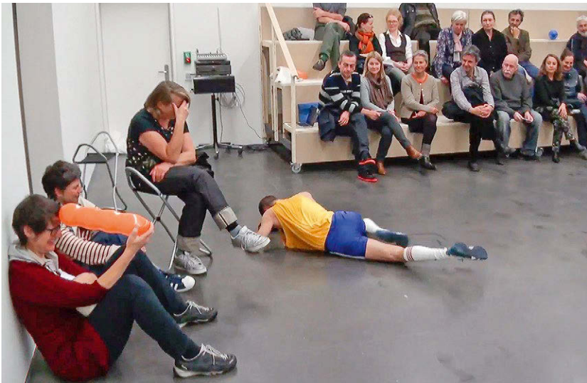
Abbildungen 27/28: Stills aus der Szene ‚Angriff‘ in Prom

Wie ironisch und vorläufig auch immer, ich lasse mich darauf ein, weil ich mir eine Position darin erwünsche. Dies bringt mich dazu, beteiligt und ansprechbar zu sein. Die Teilnahme birgt das Potenzial, aus dem Ruder zu laufen, auch wenn sie nur vorläufig ist; sie wird durch meinen imaginären Anteil zu einer echten Bindung, zu einer Fixierung, die enttäuscht werden kann und enttäuscht wird. Wie Teilhabe gelingt, sagt mir Prom nicht. Bewegt und gebunden, so schreibt es Charles