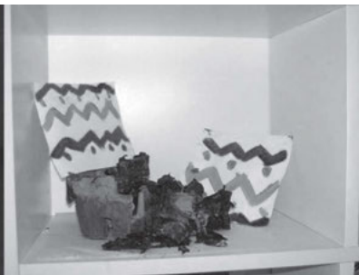
Ende im Gelände