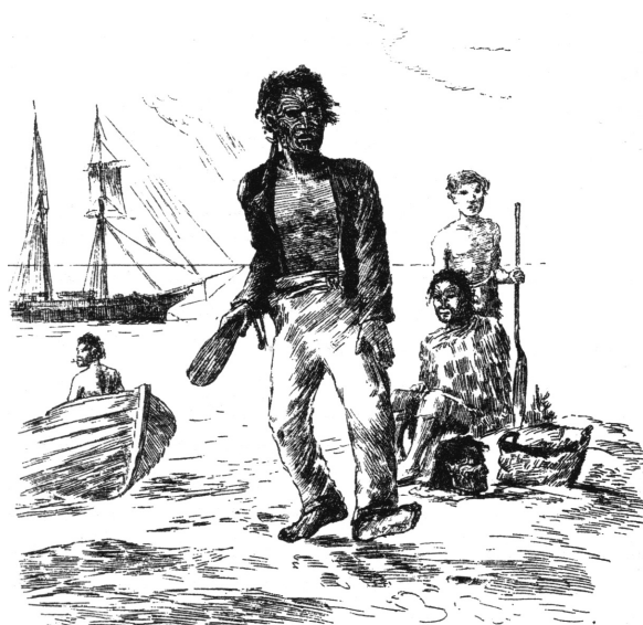
Abb. 1: Ein Maori bietet einen mumifizierten Kopf zum Kauf an (aus Robley 1896: 168).

Handels erfolgte im Jahre 1831, als Ralph Darling, der Gouverneur von New South Wales, der auch für Neuseeland zuständig war, den Handel offiziell verbot (Te Awakotuku 2004: 84). Dennoch konnte man auch noch Jahre später vereinzelt solche Köpfe erwerben (Barrow 1964: 44).