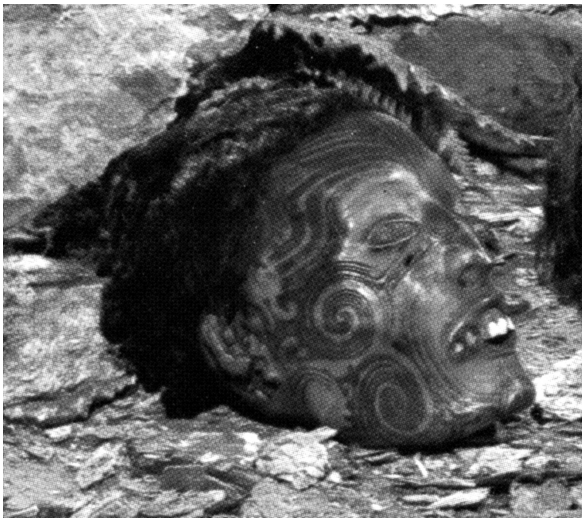
Abb. 4: Ein mokomokai aus Abb. 3, der eine post mortem angebrachte Tätowierung aufweist.

ori kommen, denn auch die in diesem spezifischen Kontext erfolgte Einbeziehung von Maori-Schnitzereien könnte möglicherweise von den Indigenen kritisiert werden. Aufgrund der Verwendung von Maori-Schnitzereien für die Darstellung der Protagonisten könnte nämlich der Gedanke aufkommen, dass hier eine emische Maori-Darstellung des mokomokai -Handels vorläge. Dies trifft jedoch keinesfalls zu! Im Gegensatz zu heute, wo im Te Papa Tongarewa Museum jeder einzelne, für "Taonga Maori" zuständige Kustos eine Zugehörigkeit zu einem oder mehreren Maori-Stämmen nachweisen kann, 11 war dies jedoch in den 60er Jahren nicht der Fall. Damals waren nur wenige Maori als Mitarbeiter des Dominion Museums angestellt und niemand von ihnen nahm die Position eines Kurators ein. 12