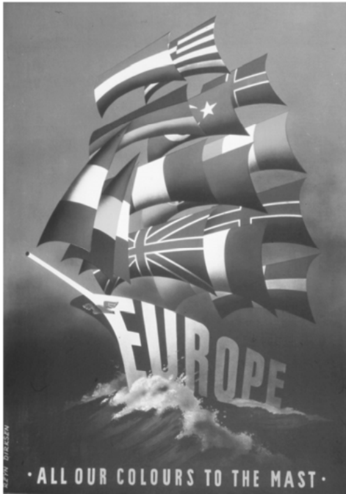
Abbildung 4: »All our colours to the mast« R. Dirksen (1950), Marshall Plan Contest Winner

Anhand dieses Bildes kann eine weitergehende Interpretation europäischen Regierens geleistet werden (vgl. auch Leibfried/Gaines/Frisina 2009). Vom Blick verborgen ist die Schiffsbesatzung, jene politischen Akteure, die als Vertreter der im Schiffsbauch befindlichen Gemeinschaftsmitglieder auf Deck ihre Aufgaben erfüllen und dabei sowohl arbeitsteilige Delegation nutzen als auch zu strittigen Themen um Wortführerschaft und Deutungsmacht ringen. Repräsentationsansprüche und Handlungsanweisungen werden einander zugerufen und sind auch unter Deck noch hörbar. Ab und an ist Wachablösung und die Akteure auf Deck werden von Personen aus dem Schiffsbauch ersetzt. Manchmal schwappen Protestwellen über die Reling und spülen neue Akteure in die Mannschaft, andere werden von Bord gerissen oder auch geschubst. In Seenot geratene Personen werden aufgelesen sofern sie entdeckt werden. Die Staats- und Regierungschefs wechseln sich halbjährlich am Steuer ab. Um den Kurs zu bestimmen, werden sie von nahezu allen niederen Mannschaftsmitgliedern beraten. Nach ausreichenden Konsultationen über anzustuernde Ziele und politische Wetterbedingungen wird Kurs gesetzt, um die Gemeinschaft voranzubringen, wobei die Winde öffentlicher Zustimmung mitunter unbeständig und wechselhaft sind. Oft herrscht auch Flaute. Nur selten kommt es zur Meuterei, aber auch das kann