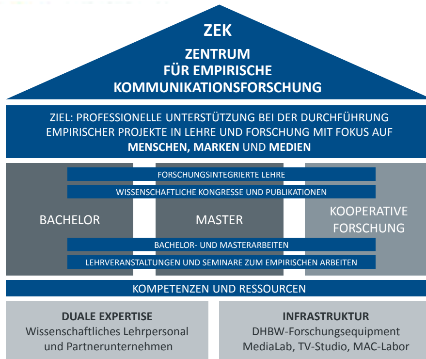
Abb. 1: Konzept des ZEK