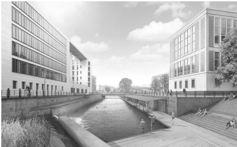
Abbildung 1: Rendering des Schwimmbereichs und des Filterbereichs/Flussbad Berlin e.V., © realities:united, 2019

Quelle: https://web.archive.org/web/20210416100812/http://www.flussbad-berlin.de/downloads (Zugriff vom 18.07.2022).