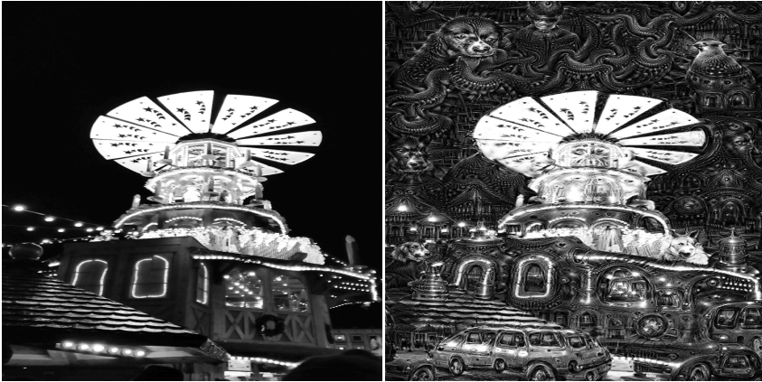
Abbildung 10.2: DeepDream – Links: Input, Rechts: Output.

die DeepDream als Webanwendung zur Verfügung stellen. 510 Dort kann ein Benutzer ein eigenes Bild hochladen, und bekommt wenig später den Output von DeepDream zurück.