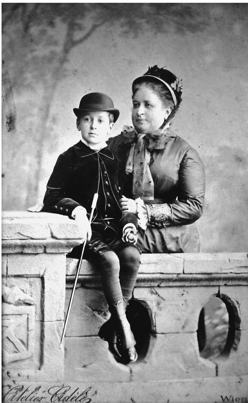
Hofmannsthal und Josephine Fohleutner um 1882 (Privatbesitz)