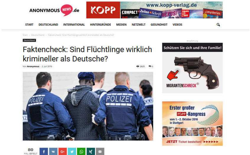
Abbildung 2.1: Werbung für Waffen und den Kopp-Verlag auf anonymousnews.ru

Waffenhandel nutzte (siehe Abb. 2.1). Dennoch zeigt der Fall: Im deutschsprachigen Internet ermöglichen Fake News perfide Geschäftsmodelle.