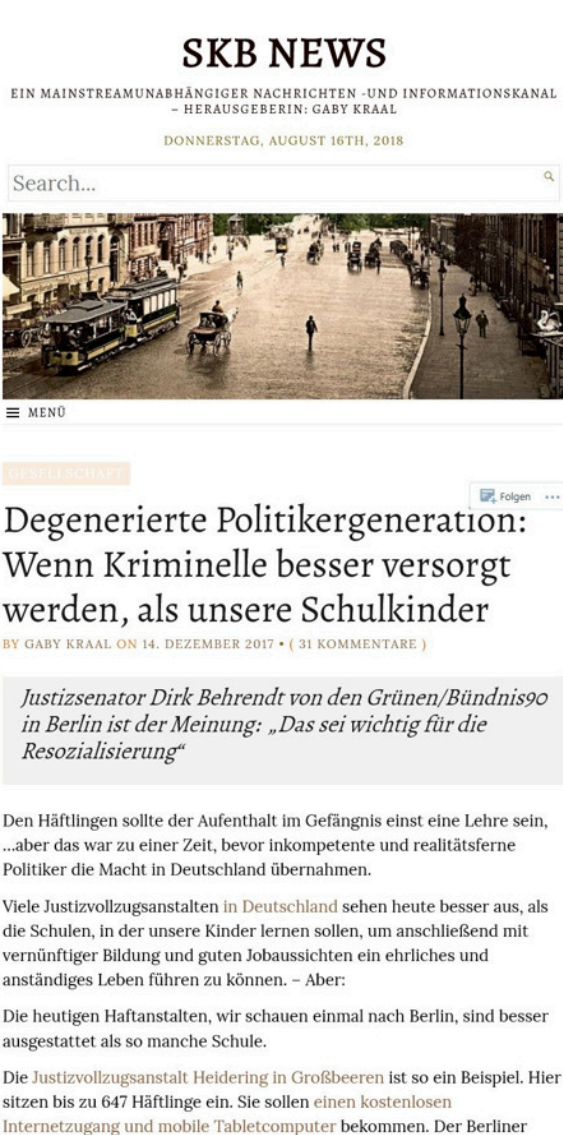
Abbildung 2.4: Populistische Fake News mit starkem Gegensatz Volk-Elite