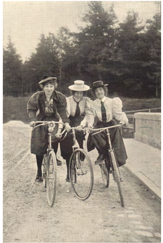
Drei Radfahrerinnen, Fotograf:in unbekannt, Anfang 20. Jh., LVR-Industriemuseum Oberhausen

Anders als in China, wo die Hose zur Frauentracht gehörte, waren Hosen in Europa gesellschaftlich lange nicht akzeptiert. Ungünstig war dies vor allem beim Radfahren. Englische Frauen entwarfen für diesen Zweck Pluderhosen ( bloomers ).