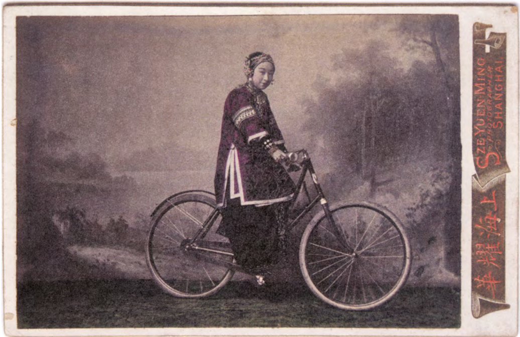
Sze Yuen-Ming & Co.: Junge Frau auf einem Importfahrrad, Shanghai 1905, Privatsammlung

In einem Shanghaier Fotostudio präsentiert sich eine junge Frau auf einem Importfahrrad. Bis in die 1930er Jahre waren Fahrräder in China ein Statement für eine prowestliche, modernisierungsfreundliche Einstellung. Besonders Frauen nutzten Fahrräder nur selten. Zunächst wurden sie vor allem von sogenannten „Sing-song Girls“ genutzt. Vermutlich handelt es sich auch bei dieser Frau um eine Kurtisane.