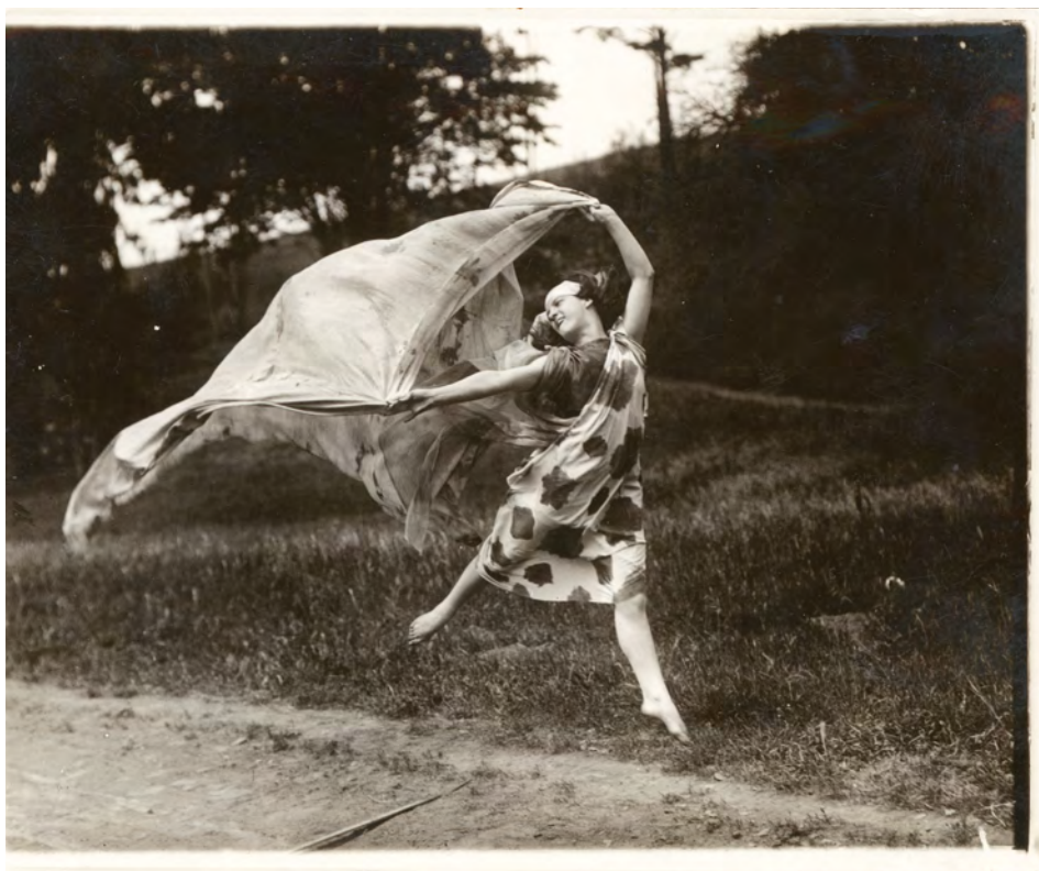
Loïe Fuller, barfuß mit einem Schal tanzend, Fotograf:in unbekannt, Schwarzweißfotografie, UC Berkeley

Loïe Fuller, handschriftliche Notiz, 1911