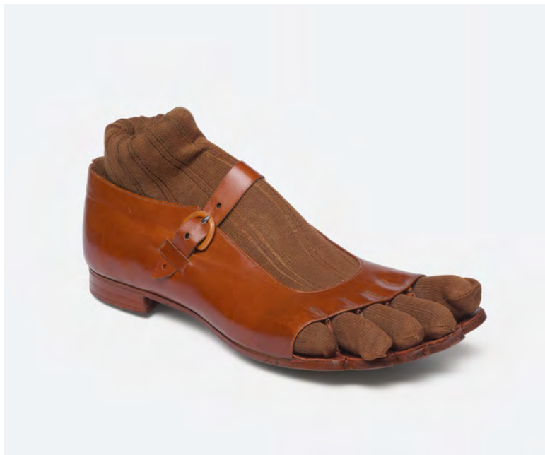
Zehenkammersandale mit Strumpf und Leisten, 7 x 27 x 9,5 cm, Reformschuh der Fa. Max Mannesmann, Remscheid, 1909, Dauerleihgabe Salzgitter AG | Konzernarchiv. Mannesmann-Archiv, Mülheim an der Ruhr im Deutschen Ledermuseum, Offenbach

Zeitgleich mit den Protesten gegen das F ü ebinden wurde auch in Europa Kritik an der Schuhmode laut. Der holl ä ndische Arzt Petrus Camper hatte schon 1781 die Unsitte kritisiert, beide Schuhe auf demselben Leisten zu arbeiten. Vor allem h ä ufige Fuprobleme von Soldaten bef o rderten die Reformbewegung. Sebastian Kneipp brachte, zun ä chst bel ä chelt, B ü rg er :innen dazu, barfu durch betautes Gras zu laufen, der Reformschuh der Firma Mannesmann versprach Bel ü ftung und Zehenfreiheit.