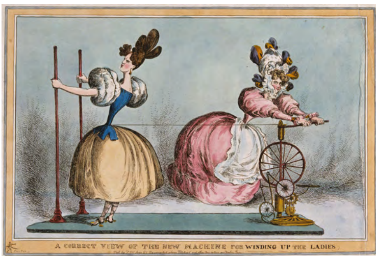
Abb. 1 William Heath: A correct view of the new machine for winding up the ladies, um 1830, Farblithographie, Wellcome Collection, London