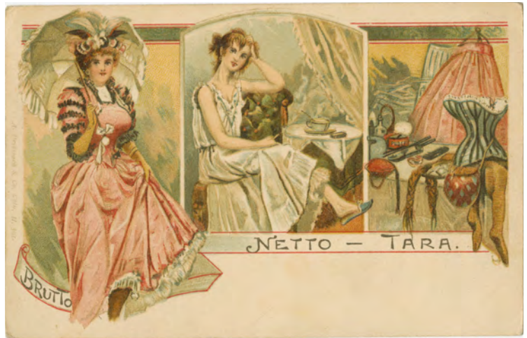
Abb. 3 Brutto - Netto - Tara, Postkarte, Deutschland, 1899, Privatsammlung

nen. Seit den 1890er Jahren gründeten sich zahlreiche „Vereine zur Verbesserung der Frauenkleidung“, die sich auch für die Reformierung der Berufskleidung einsetzten, denn Bewegungsunfähigkeit bedeutete Arbeitsunfähigkeit. Neben der Behinderung durch das Korsett ging es dabei vor allem um das Gewicht, das durch die enormen Stoffmassen von Unterröcken und Schleppe entstand. Und nicht nur die „Strassenkehrmaschine Rock“ 21 musste gestemmt werden, auch die Frisur mit Mengen von falschen Haarteilen, Hut und anderen Verzierungen hatte ein ordentliches Gewicht.