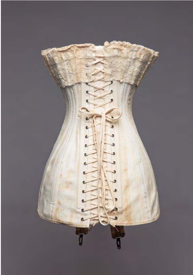
Modell RFC à la Princesse, Baumwolle, Fischbein, Metall, Rosenthal, Fleischer & Cie. Korsettwaren, 39 x 34 x 25 cm, Göppingen, um 1915

Um 1900 kam das von der Medizinerin Inès Gaches-Sarraute entwickelte Sans-ventre -Korsett auf den Markt, es sollte die Organe nicht quetschen und keine Schnürfurchen in der Haut verursachen. Die Meinungen zu diesem Korsett gehen auseinander: Josephine Barbe geht davon aus, dass es oft zu eng getragen wurde und außerdem die Wirbelsäule in eine übertriebene S-Form bog, weswegen es „vermutlich nicht weniger körperschädigend als jedes Korsett zuvor“ war (Barbe 2012, 83), Sabine Welsch hingegen bezeichnet es als „das gesundheitsschädlichste, qualvollste Schnürmieder in der langen Geschichte dieses Folterinstruments“ (Welsch 1996, 10).