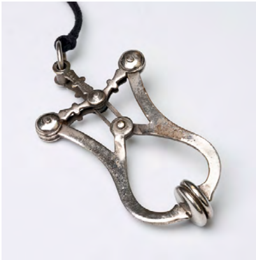
Patentierter Rockraffer, Anfang 20. Jh., Metall, Deutsches Fahrradmuseum Bad Brückenau