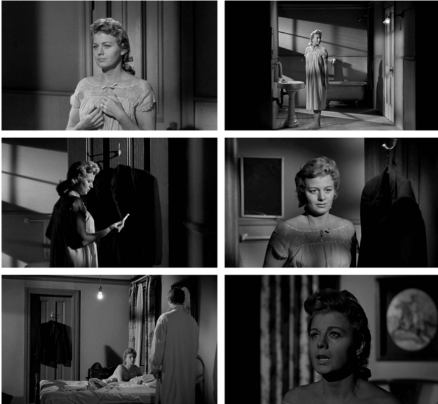
Abb. 281-286: THE NIGHT OF THE HUNTER (1955). Charles Laughton, K: Stanley Cortez

wohlwollend betrachtet hat, zeigt nun nur noch ein opakes, undurchdringliches Schwarz (Abb. 284). Eingefasst von dem weißen Holzrahmen wirkt dieses Schwarz wie ein abstraktes Bild im Bild: Ausdruck einer Bildfarbe, die sich hier zugleich zu einem metaphorischen Entrée in den Tod verdichtet, der Willa im weiteren Verlauf ihrer Ehe mit Powell bevorsteht. Die konzeptuelle Dringlichkeit dieser Bildkonstellation erinnert an die Szene im Eisladen und an die oben analysierte Einstellung, in der schwarze Fensterbalken – gleich einer abstrahierten, rechteckigen Sargform – Willa einrahmen und isolieren.