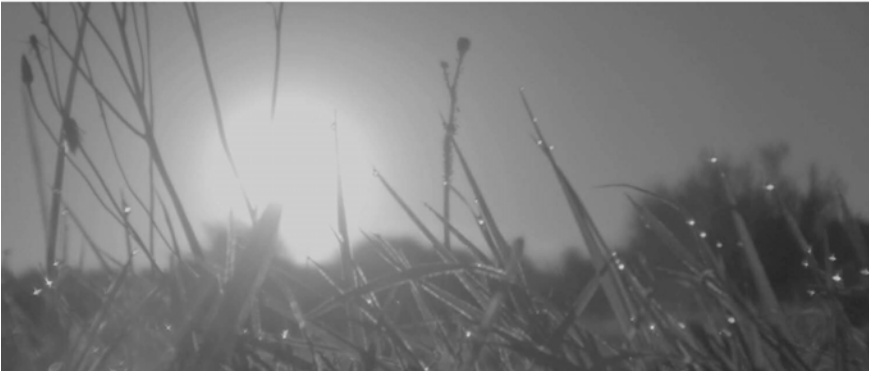
Abb. 313-314: A FIELD IN ENGLAND (2013). Ben Wheatley, K: Laurie Rose