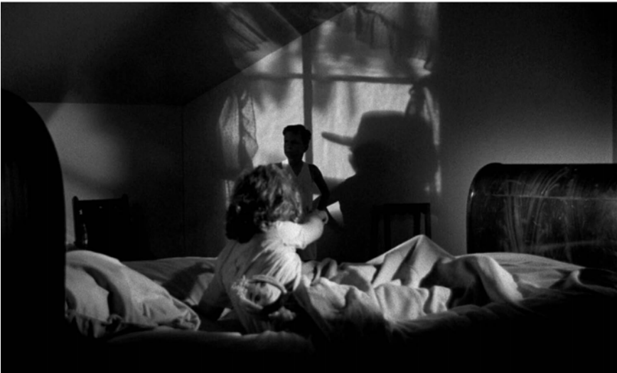
Abb. 290-294: THE NIGHT OF THE HUNTER (1955). Charles Laughton, K: Stanley Cortez