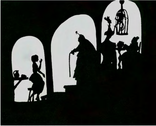
Abb. 303: ASCHENPUTTEL (1922). Lotte Reiniger. Film Still ( Aschenputtel geht zur Stiefmutter )

Diese Cut-outs fungieren darüber hinaus als eine weitere Ausdrucksfläche der Farbe Schwarz: Farbe als Abbild und als Artefakt, 84 Bestandteil der fiktionalen Welt und Zeichen ihrer artifiziellen Gestaltung. Nicht Imitation, sondern die bewusst exponierte Stilisierung bestimmt die besondere Atmosphäre dieser Sequenzen. Eine derartige Stilisierung prägt auch spätere filmische Beispiele, etwa Woody Allens MANHATTAN (1979), in dem die Silhouettenästhetik jene Szenen bestimmt, in denen die Protagonisten, ob bei einer Cocktailparty im Museum of Modern Art oder beim Sonnenaufgang hinter der Brooklyn Bridge, in entrückter Zweisamkeit erscheinen. Im Einklang mit den Gefühlsbewegungen der Figuren wird die Stadtkulisse von Manhattan poetisch – und zugleich genuin filmisch – überhöht, insofern Allen Wirklichkeit und Kunst auf der Leinwand ineinander übergehen lässt. 85