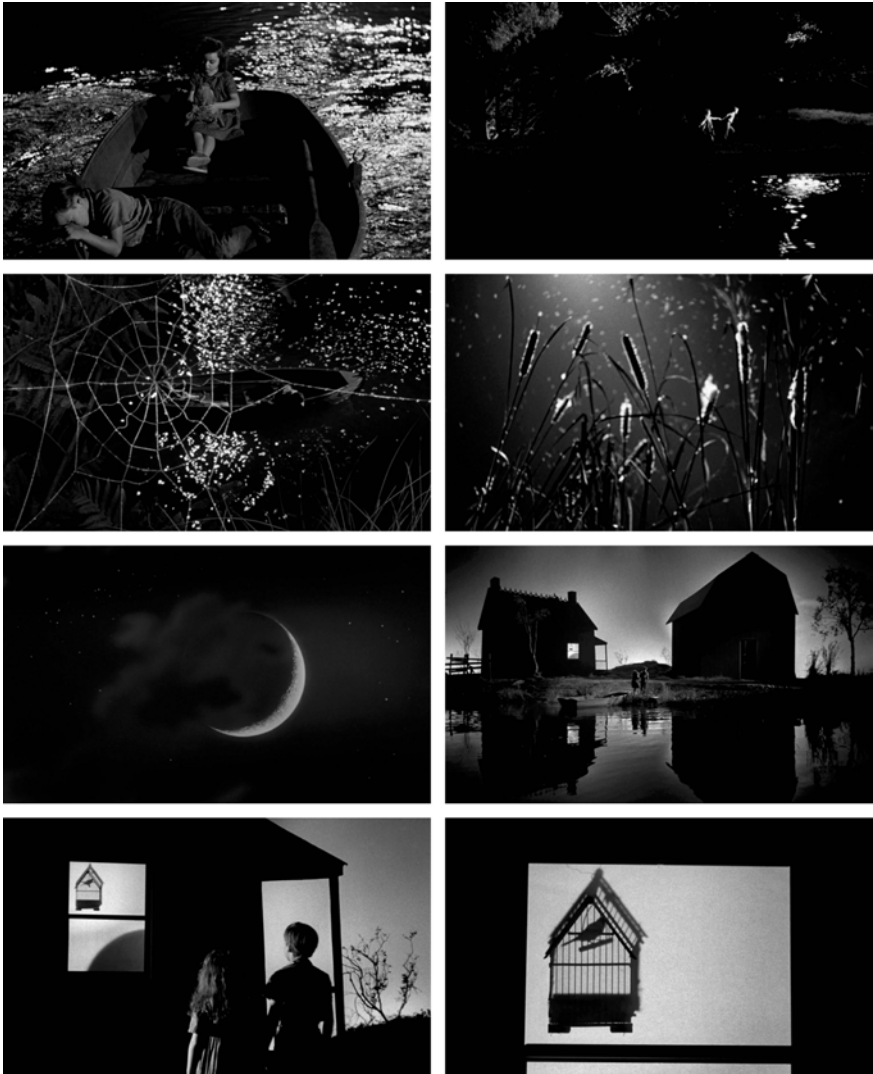
Abb. 295-302: THE NIGHT OF THE HUNTER (1955). Charles Laughton, K: Stanley Cortez

kann zu einem Traum werden – und nur aus einem Traum kann man im Licht erwachen.« 80