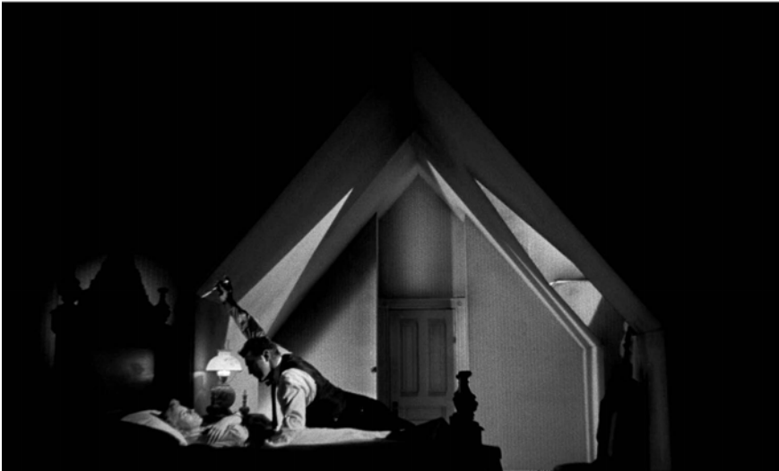
Abb. 287-289: THE NIGHT OF THE HUNTER (1955). Charles Laughton, K: Stanley Cortez

»Mir kommt häufig so vor, als wäre das Kino, insbesondere in seiner Schwarz-Weiß-Ästhetik, von einer Sehnsucht nach den tiefsten Tönen des Schwarz getragen«, schreibt Harald Haarmann in Schwarz. Eine kleine Kulturgeschichte (2005). 40 Tatsächlich erscheint gerade der Schwarz-Weiß-Film dazu prädestiniert, dieser »Sehnsucht« bildlichen Ausdruck zu verleihen. Allerdings setzen auch zahlreiche Farbfilme auf den Ausdruckswert der Farbe Schwarz. Stan Brakhages BLACK ICE (1994), Alejandro Amenábar's THE OTHERS (2001), Hélène Cattets und Bruno Forzani's AMER (2009) und Jonathan Glazers UNDER THE SKIN (2013) sind Beispiele für eine Farbfilmästhetik, in der ein stark ausgeprägtes Schwarz die Inszenierung visuell und inhaltlich trägt. Dabei wurde über die Bedeutung dieser Farbe im Film bislang wenig publiziert – ebenso über ihre kunsthistorische Tragweite, die bis in die altsteinzeitlichen Anfänge visueller Bildkultur zurückreicht. Dazu Pierre Soulages: »Über viele Jahrhunderte sind die Menschen an die dunkelsten Orte gegangen, unter die Erde, in Grotten, um dort mit der Farbe Schwarz zu malen. Es gab