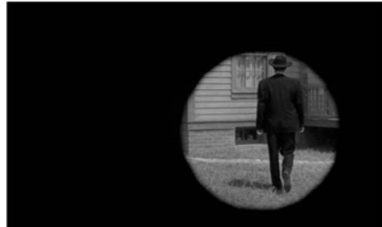
Abb. 275-277: THE NIGHT OF THE HUNTER (1955). Charles Laughton, K: Stanley Cortez

Bei der anschließenden Überblendung überlappen sich das Bild mit Willas Leiche und das mit Powell vor Harpers Haus, in dessen Keller John und Pearl sich gerade vor ihrem Peiniger versteckt haben. Laughton lässt die Überblendung bewusst lange stehen, sodass sich die weißschimmernde Erscheinung der Toten wie ein Schutzschild zwischen Powell und die Kinder schiebt (Abb. 276). Umso symbolträchtiger wirkt die anschließende Irisblende: Gleichmäßig breitet sich schwarze Dunkelheit kreisförmig von den Bildrändern her aus, während Powell auf den Hauseingang zugeht, bis schließlich nur noch die Fenster des Kellerraums im Fokus stehen (Abb. 277). Dabei wird Willas lichte Erscheinung in nuce ausgelöscht. Die Irisblende erfüllt hier eine doppelte Funktion: Zum einen akzentuiert sie Powells bedrohliche Präsenz, indem sie die Kinder sowohl im wörtlichen als auch im übertragenen Sinn »einkreist« 21 – als drohendes Dunkel, symbolische Falle, potenzielles Todesschwarz. Und zum anderen fungiert sie als filmhistorische Referenz: Zur Entstehungszeit von THE NIGHT OF THE HUNTER war die Irisblende, einst zentrales