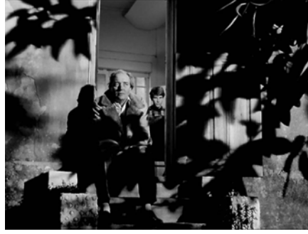
Abb. 311-312: O SANGUE (1989). Pedro Costa, K: Martin Schäfer