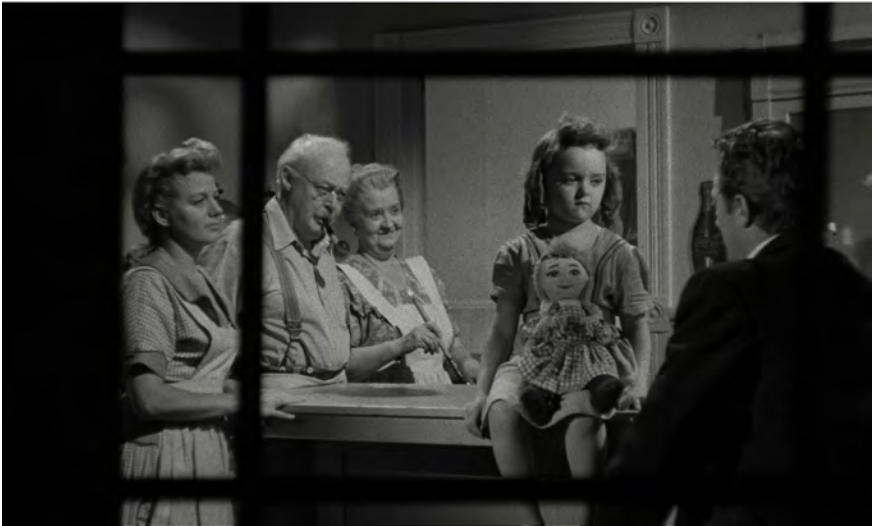
Abb. 278-280: THE NIGHT OF THE HUNTER (1955). Charles Laughton, K: Stanley Cortez

Wie maßgeblich die ästhetische Präsenz und Wirkung der Farbe Schwarz in THE NIGHT OF THE HUNTER an die Tektonik des Bildraums, die Kameraperspektive, die Lichtführung und die dramaturgische Setzung einzelner Szenen gebunden ist, zeigt exemplarisch die Sequenz im Eisladen. Die Kamera ist außerhalb des Ladens positioniert und visiert frontal dessen Fensterfront. Dunkle Fenstergitter formen im Kontrast zum hellen Inneren des Raums eine innerbildliche Rahmung (Abb. 280). Schwarz fließt durch die Balken in direkter Korrespondenz zum Schwarz von Powells Anzug, der im rechten Bildbereich mit dem Rücken zur Kamera steht. Pearl und ihre Puppe, in der das Geld versteckt ist, sitzen ihm direkt gegenüber an der Theke, seinem Blick ebenso ausgeliefert wie dem des Kinopublikums. Im linken Bildteil isoliert ein einzelner vertikaler Fensterbalken Willa vom Rest der Gruppe – ein bemerkenswerter Kunstgriff, der ihre spätere Ermordung durch Powell sinnbildlich antizipiert. Da es sich hierbei um eine Point-of-View-Einstellung aus der Perspektive Johns auf die Fensterfront handelt, wird deutlich, dass dieses Schwarz nicht naturalistisch, sondern subjektivierend verwendet wird: Es entspringt der Empfindung Johns, der als Einziger Powell durchschaut, in ihm nicht einen Heilsbringer, sondern einen gefährlichen Bösewicht erkennt. In dieser Bildkomposition oszillieren Powells Absichten, seine »Einkreisung« der Familie Harper, der er ei-