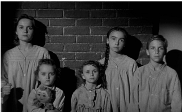
Abb. 308-310: THE NIGHT OF THE HUNTER (1955). Charles Laughton, K: Stanley Cortez

Mit der Kraft dieser Bilder vor Augen wird verständlich, weshalb THE NIGHT OF THE HUNTER trotz seiner anfänglich verhaltenen Rezeption zu einem der einflussreichsten Filme avancieren konnte. Ungebrochen bleibt die Nachwirkung dieses Werks, wie zahlreiche Referenzen und Hommagen belegen – von RAISING ARIZONA (1987) und THE BIG