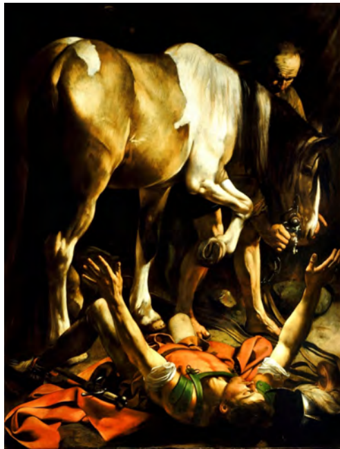
Abb. 305: Michelangelo Merisi da Caravaggio, Conversione di San Paolo , 1600–01. Öl auf Leinwand, 230 × 175 cm. Santa Maria del Popolo, Rom