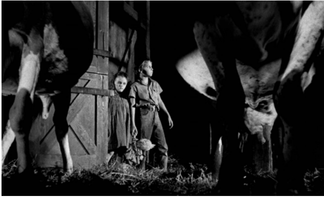
Abb. 304: THE NIGHT OF THE HUNTER (1955). Charles Laughton, K: Stanley Cortez