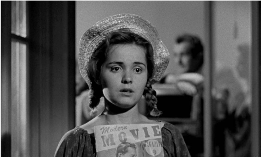
Abb. 272-274: THE NIGHT OF THE HUNTER (1955). Charles Laughton, K: Stanley Cortez

Und da ist noch eine andere Grenze: die zwischen Leben und Tod, der auf der Leinwand nie ganz endgültig zu sein scheint. Diesen Schwebезustand reflektiert eine besonders eindrucksvoll ausgeleuchtete Einstellung des Films mit Willa als Wasserleiche. Das Schwarz des Wagens, an den Powell sein Opfer gebunden und im Fluss versenkt hat, hält den Leichnam am unteren Bildrand fest, während bewegte Sonnenstrahlen dem Körper der Toten eine schwerelose Leichtigkeit verleihen (Abb. 275). Laughton knüpft damit an die in der Kunstgeschichte prominente Bildtradition der Ophelia an, der tragischen Heldin aus Shakespeares Hamlet (1603). 18 Der Fokus richtet sich hier vor allem auf das Licht im Rhythmus der Unterwasserströmung. Wenn Jeffrey Couchman THE NIGHT OF