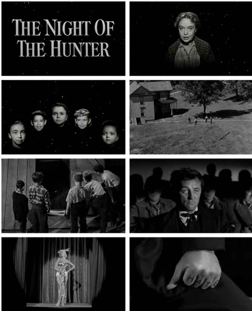
Abb. 264-271: THE NIGHT OF THE HUNTER (1955). Charles Laughton, K: Stanley Cortez

Bereits in diesen frühen Szenen offenbart sich THE NIGHT OF THE HUNTER als ein Film, der die Konventionen des filmischen Erzählens reflektiert und dabei die suggestiv wirkende Macht des Kinos explizit ausstellt, ohne die Erzählung in den Hintergrund treten zu lassen. Die Bedeutung des Lichts wird geradezu exponiert, indem quer durch den Film diverse Beleuchtungsarten zur Anwendung kommen. Ihr kontrastiver Einsatz verstärkt die mediale Reflexion der verwendeten cinematischen Mittel. Eine Schnitt- und Szenenfolge illustriert dies besonders eindrücklich – im markanten Kontrast von High-Key- und Low-Key-Beleuchtung. Es handelt sich um eine Sequenz, die die Ankunft des Wanderpredigers im Dorf der Familie Harper ankündigt. Zunächst sieht man Willa und