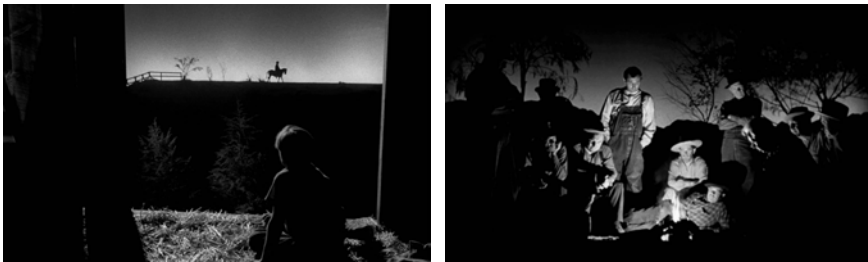
Abb. 306-307: THE NIGHT OF THE HUNTER (1955). Charles Laughton, K: Stanley Cortez

Nachfolgend kombiniert Laughton tiefenräumliches Helldunkel mit der flächigen Scherenschnitt-Ästhetik. Eine rechteckige Öffnung in der Holzwand der Scheune rahmt den Ausblick auf die dahinterliegende Landschaft. Die Kinder sind eingeschlafen. Die Statik der vordergründigen Szene nutzt Laughton, um mittels zweifacher Überblendung die Nacht im Zeitraffer vergehen zu lassen. Dreimal verändert die Mondsichel ihre Position am Himmel. In der Morgendämmerung erscheint Powells schwarze Silhouette am Horizont: hoch zu Pferd, klar konturiert vor dem sich aufhellenden Himmel (Abb. 306). 88 Johns erschöpft-ungläubige Frage »Don't he never sleep?« akzentuiert diesen Moment. Doch die sanfte Lichtstimmung des anbrechenden Tages konterkariert die Bedrohung.