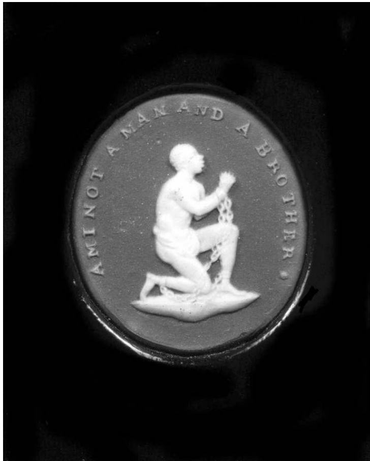
Abb. 3: Anti-Slavery Medallion – seit 1787 von dem Porzellanfabrikanten Josiah Wedgwood verbreitet.