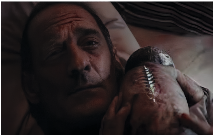
( Img. 11: TITANE (2021): Espina dorsal “metalizada” del hijo de Alexia/Adrien.).

de las sociedades burguesas, casi desde mediados del siglo XIX. Estas líneas no son el lugar para efectuar una profundización en el análisis de los planteamientos ideológicos que circundan este núcleo narrativo; sin embargo, cabe poner en relieve el hecho que es justamente en el ambiente de su huida, allí donde vive con el jefe de bomberos que la toma por su hijo perdido, en donde logra establecer un vínculo afectivo estable, justamente con una persona que resulta requerir de la intervención protésica de las inyecciones de testosterona para asegurarse su supervivencia. De esta manera, el contexto desestructurado que rodea a Vincent, cabeza de un cuerpo de bomberos, quien simbólicamente requiere de un falo protésico para sobrevivir, representa el único espacio donde la alteridad, visual y metafísica, si se quiere, de Alexia alcanza a asentarse y es tolerada de una forma más o menos exitosa. Este hecho alcanza su momento de paroxismo cuando el embarazo de Alexia es imposible de esconder, y toda la ficción que envuelve a su tecnocuerpo, se convierte en insostenible, una secuencia que culmina con Vincent ayudándola a traer al bebé al mundo. Un bebé, éste, que metafóricamente lleva incrustado en su médula espinal la marca de la alteridad, de la aparentemente fructuosa unión entre máquina y humano, entre carne y metal