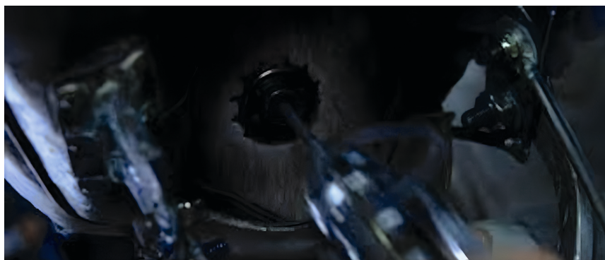
(Imgs. 4–5: TITANE (2021): Trinity conectando a Neo a la Mátrix; Close-up del terminal corporal de conexión a la máquina.).

Sin embargo, y esto se entabla como un común denominador a las obras de tipo audiovisual citadas anteriormente, la disolución del panorama social encuentra una reproducción metafórica en la disolución de las fronteras del cuerpo de las figuras envueltas, así, por ejemplo, en The Matrix ,