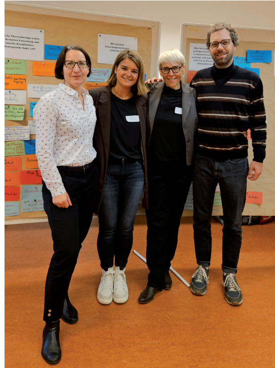
Fachgruppe Diversität und Intersektionalität

Der Titel „Diversität und Intersektionalität“ betont eine kritische Auseinandersetzung mit machtvollen Differenzordnungen und er bezieht sich auf soziale emanzipatorische Bewegungen, die gesellschaftliche Veränderungen mit dem Ziel sozialer Gerechtigkeit und Chancengleichheit bewirken wollen. Die Fachgruppe bearbeitet ein Querschnittsthema in der Sozi-