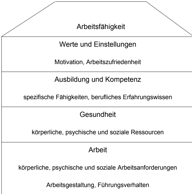
Abb. 1: Haus der Arbeitsfähigkeit nach Ilmarinen und Tempel (2002); eigene Darstellung

Lebensweltorientierung, Bezüge zur Bevölkerungsstruktur und Reflexion institutioneller Faktoren sind nicht zu trennen. Wenn dann beispielsweise die Aufmerksamkeit für die Wirkungen alternder Belegschaften 19 steigt, addieren sich zugleich weitere Vielfaltsfaktoren, wie Sinnesleistungen (Sehen, Hören etc.), Bewegungsabläufe (Gehen, Greifen eines Gegenstandes, Sitzen etc.), mentale Leistungen (Erinnern, Konzentrieren, Reflektieren etc.) und kommunikative Leistungen (Informieren, Unterhalten, Beraten etc.), in Wechselwirkung mit Kontextfaktoren, die fähigkeitsgerechte