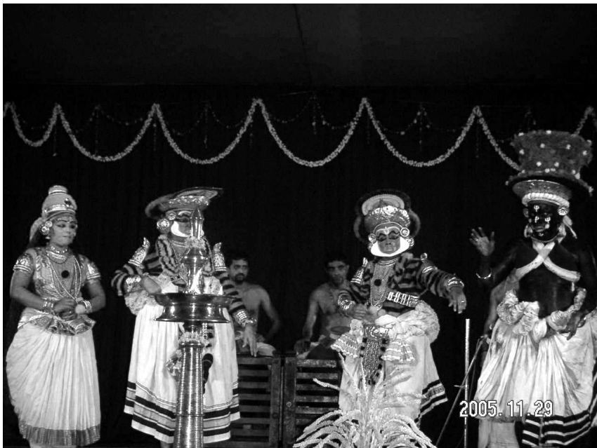
Abb. 1: Kūṭiyāṭṭam -Performance mit Kalamandalam Artists, Trivandrum 2005.

Laut Panchal (1984: 62) bilden alle soeben genannten Instrumente gemeinsam mit einem Blasinstrument ( kuṟuṅ kuḷal ), das in früheren kūṭiyāṭṭam -Performances verwendet wurde, und der Muschel saṅkhu , die den Beginn einer Performance ankündigt, die pañchavādyam – fünf Instrumente – des kūṭiyāṭṭam . Anleitungen zur Verwendung der Musik wie auch zu den Bewegungen der PerformerIn-