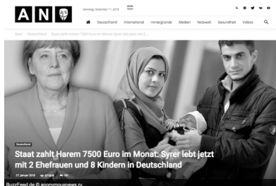
Abb. 56: Bild-Text-Kombination einer Desinformation über Familienstrukturen und den Sozialstaat 155