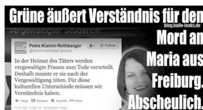
Abb. 55: Bild-Text-Kombination einer Desinformation über Misogynie und Tradwives 126