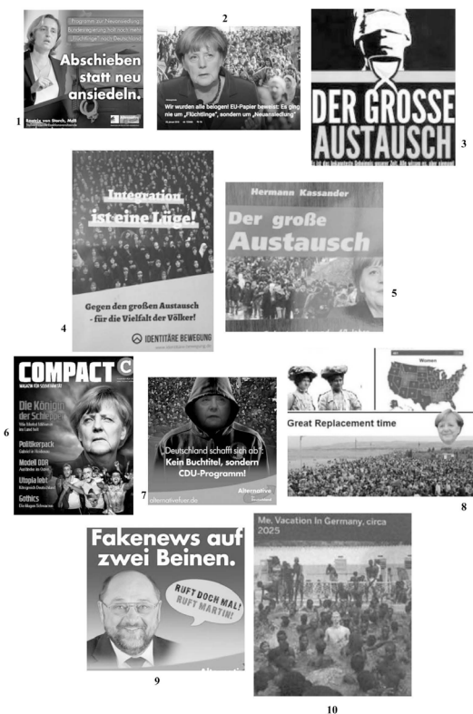
Bildtafel 1: Kontextualisierung eines Bildes einer Desinformation mit rechten Bildmotiven (Bildanalyse 1) 112