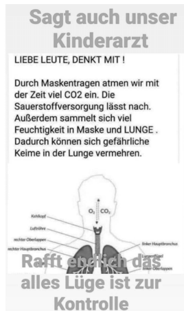
Abb. 57: Sharepic einer Desinformation über die Coronapandemie 170