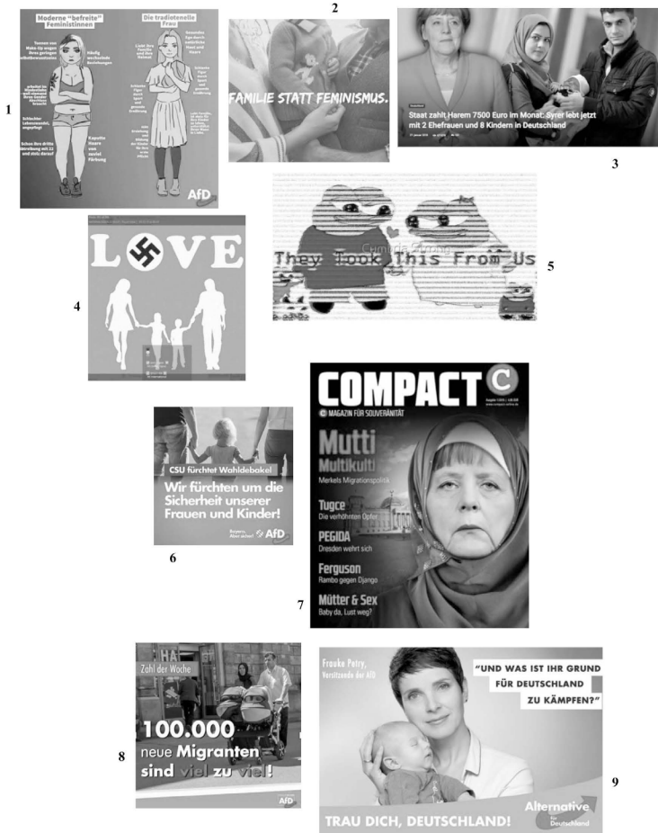
Bildtafel 3: Kontextualisierung eines Bildes einer Desinformation mit rechten Bildmotiven (Bildanalyse 3) 164