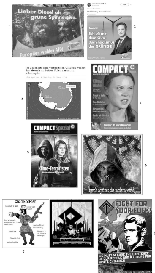
Bildtafel 5: Kontextualisierung eines Bildes einer Desinformation mit rechten Bildmotiven (Bildanalyse 5) 239