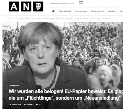
Abb. 54: Bild-Text-Kombination einer Desinformation über den ›Großen Austausch‹ 87

Eine blau gekleidete Frau ist auf der linken 88 Bildhälfte platziert. Im rechten Bildabschnitt befinden sich hinter ihr zahlreiche auf sie zuströmende Personen, die eine bunte und unübersichtliche Menschenmasse bilden. Überschriften ist die Darstellung mit dem Text: »Wir wurden alle belogen! EU-Papier beweist: Es ging nie um ›Flüchtlinge‹, sondern um ›Neuansiedlung‹« (Abb. 54). Zu sehen sind die ehemalige Bundeskanzlerin Angela Merkel und eine Gruppe Geflüchteter, darauf lassen Kopftücher und die begriffliche Markierung in der Überschrift schließen (›Flüchtlinge‹). Manche Personen der Gruppe lachen, andere schauen resigniert auf den Boden oder tragen Kleinkinder auf den Schultern. Beide Bildmotive sind den Betrachter*innen zugewandt. Merkel ist deutlich größer dargestellt als die anderen Menschen, wodurch die Szene surreal wirkt. Die Vielzahl der Personen sowie ihre vertikale und geschwungene Anordnung führen zu einer dynamischen und unruhigen