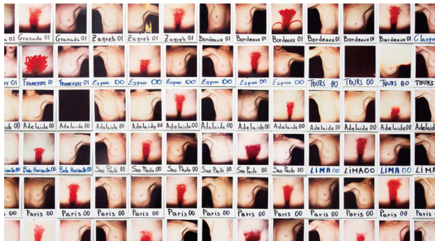
Abbildung 9: Otra Narcisa, Polaroid-Kompositum, Centro Párraga Murcia 2016

Die Polaroidperspektiven fragmentieren den Körper von La Ribot bildlich und werden im Kompositum entsprechend über die jeweilige Zeit-Raum-Konstellation der Aufnahmen und Aufführungen hinweg anders bzw. neu zusammengesetzt (d.h. konstelliert). Die von Albright beschriebene mehrfache Spaltung des (tänzerischen) ›autobiografischen‹ Selbst in eine durch Choreografie bzw. Tanz hergestellte, auf den ersten Blick als Gesamtheit erscheinende Körperlichkeit findet in dieser künstlerischen Praxis eine Entsprechung. 144 Das darin referierte Ich führt, so meine These, zu Figurationen von im-/mobilen Selbstentwürfen. Bei diesen Figurationen wird die vermeintliche körperliche