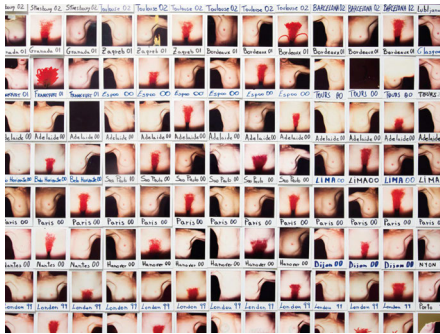
Abbildung 11: Otra Narcisa , Polaroid-Komposition. Centro Párraga Murcia 2016 © Guillermo Gumiel und Vacío Studio