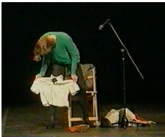
Abbildung 3: Socorro! Gloria! , Madrid 1991 © La Ribot, Filmstill

Die derart entstandenen Assoziationen zu Tanztraining und Bühnentanz verdeutlichen, dass dessen Produktionsbedingungen nicht unabhängig von der Tanz-Rezeption zu denken sind, beispielsweise wenn Publikumserwartungen von den Künstler*innen antizipiert werden, um auf ästhetischen Märkten sichtbar und erfolgreich zu sein. Ähnlich gelagerte Erwartungen, wie jene, dass Tänzerinnen in körperbetonten Kostümen auftreten, werden in Socorro! Gloria! unterlaufen, indem La Ribot eine Körperlichkeit inszeniert, die sich im Grenzbereich zwischen tanzstilistisch überformten und alltäglichen