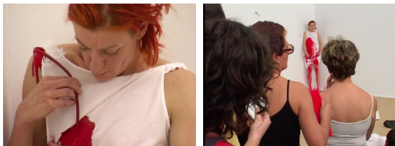
Abbildung 4: 4.1 bis 4.2 Piezas N°5 Eufemia , Genf 2004, Filmstills aus La Ribot distinguida von Luc Peter © La Ribot