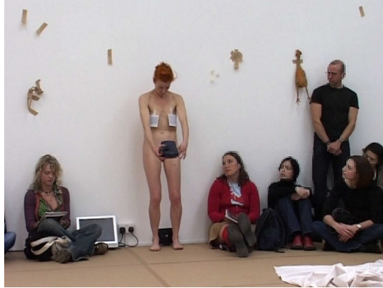
Abbildung 10: Pieza N°16 Narcisa, Genf 2004, Filmstill der Dokumentation La Ribot distinguida von Luc Peter

Der Theaterwissenschaftlerin und Performerin Annemarie Matzke zufolge kann ein Bühnen-Selbst weder als Urheber seines Sprechens noch seiner Handlungen bestimmt werden. 148 Es ist vielmehr als Sprechinstanz zu verstehen, denn es präsentiert sich als Subjekt von Aussagen, dem »weder Autonomie noch ein inneres Selbst zugeschrieben werden« 149 kann. Subjektivität beschreibt demnach mit Matzke den »Entwurf eines Selbstverhältnisses«, 150 das in der wechselseitigen Bezugnahme auf Darstellung und Rezeption immer wieder aufs Neue ausgehandelt und hergestellt werden muss. Die mit dieser Perspektive verknüpften, von Brandstetter im Handbuchartikel Autobiography in/as Dance angeführten konstitutiven Merkmale autobiografischer Performances, namentlich »a retrospective narration« 151 und ein sich durch das Auf-