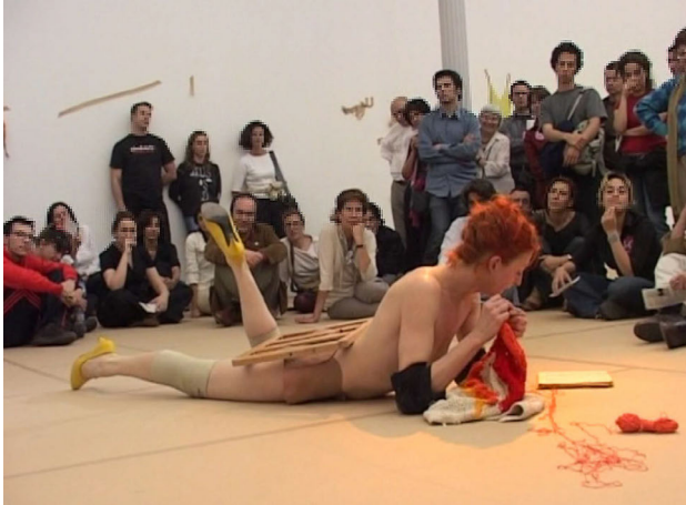
Abbildung 5: Pieza N°31 de la Mancha , Genf 2004, Filmstill aus La Ribot distinguida von Luc Peter © La Ribot

Weder kommentiert die Künstlerin ihr Tun, noch geht sie näher auf Cervantes' Erzählung oder andere kulturelle Bezüge zu Spanien ein. Dadurch, dass die mit Don Quijote assoziierten Narrative nicht auserzählt werden, geht es weniger um deren Inhalte als um den spielerisch-variablen Umgang mit ihnen. Das Häkeln ist dabei eine in den bildenden Künsten oft zitierte, weiblich konnotierte Verrichtung, die im Zusammenhang mit den Ballettexerzitien für eine soziale Disziplinierung steht, die der »eigentlichen großen« Kunst (beispielsweise dem Lesen von Don Quijote) nicht zuträglich ist. Umgekehrt verschiebt sich mit der Alltagsreferenz auf das Häkeln jedoch auch der Blick auf die Erzählung Don Quijote – solche Effekte werden noch eingehender anhand der Konstellation von Gabriele Stötzer betrachtet (vgl. Abschnitt 1.2.).