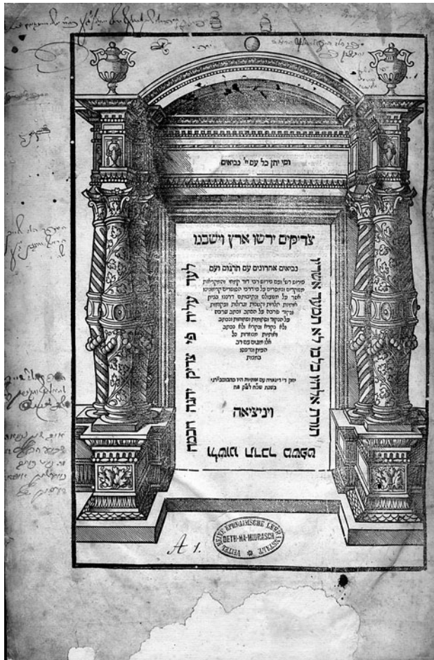
»Mikra'ot Gdolot«, Rabbinerbibel zu den Hinteren Propheten u.a. mit den Kommentaren von Raschi und David Kimchi. Venedig 1568