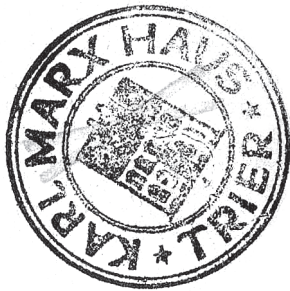
3 Stempel des Karl-Marx-Hauses Trier, gefunden im Bestand der Württembergischen Landesbibliothek Stuttgart

vor das Hauptarchiv der NSDAP an dem Bestand bedient hatte, in der Folge waren z. B. nicht mehr alle von der Staatsbibliothek angeforderten Titel vorhanden. 12 Aus dem im Geheimen Staatsarchiv verbliebenen Bestand erhielt dann 1940 das Institut für Staatsforschung in Berlin-Wannsee nachweislich 3.618 Titel. Weitere 1.300 Titel wurden im gleichen Jahr an das Staatswissenschaftlich-Statistische Seminar der Friedrich-Wilhelm-Universität übergeben. 13 Das Geheime Staatsarchiv behielt einen Restbestand.