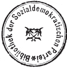
2 »Lilien-Stempel« der zentralen SPD-Bibliothek