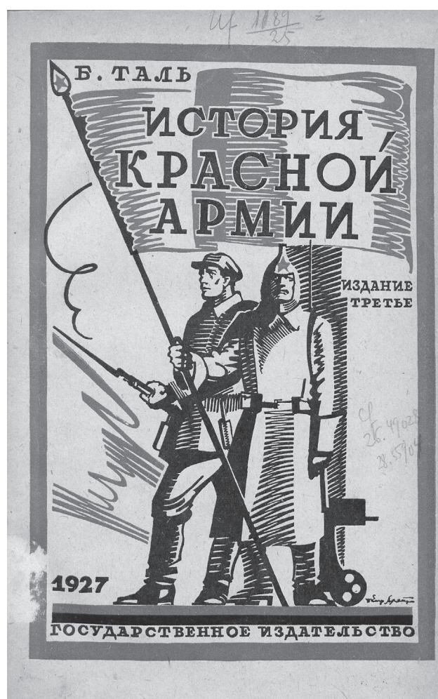
1 Russische Druckschrift aus dem beschlagnahmten Bestand des Instituts für Sozialforschung zur Geschichte der Roten Armee

Als Nachfolgeinstitution arbeitet die Staatsbibliothek zu Berlin – Preußischer Kulturbesitz seit 2007 systematisch an der Suche nach NS-Raubgut in ihren Beständen und hat dazu einen eigenen Arbeitsbereich in der Ab-