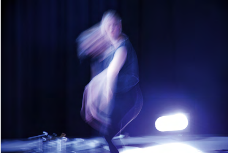
Abb. 2: EchoPerformance

Der Körper formt sich aus zusammengezogener Geste – aussagekräftig wie eine Signatur – sich ausstreckend, mit Kraft aus dem Zentrum und klaren Konturen, die Außengrenzen des Körpers gewinnen an Präsenz, der Tonus nimmt zu, wie auch die Oberfläche des Schwarzen Meeres eine tragende Kraft birgt.