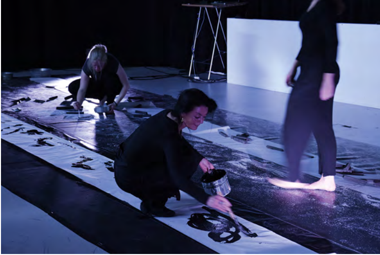
Abb. 1: EchoPerformance

Die Dynamik der Handlungen tendiert zwar in Schreibrichtung nach rechts, schwingt aber aufgrund rückläufiger Bewegungen zugleich wie Brandungswellen vor und zurück. Die Aufzeichnungen auf den Bahnen werden im Lauf der Performance immer wieder verwischt, verändert, überschrieben oder gelöscht und schichten sich infolgedessen im Unsichtbaren. Geräusche, die das Hantieren mit dem Salz, den Zinkeimern, dem Papier und den Hölzern hervorruft, Klänge und Worte, treten sowohl zueinander als auch zu den sichtbaren Dingen und Bewegungsverläufen in vielfältige Beziehungen und bilden einen untergründigen Rhythmus. Dieses Rhythmische verschafft sich insbesondere durch die Hölzer, sooft sie als Trommelschlegel genutzt werden, Gehör. Visuelle und auditive Ereignisse überlagern sich gleichsam in mehreren Sphären und geben einer Atmosphäre des Salzes Raum.