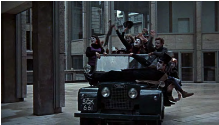
Abb. 125: BLOW-UP (1966). Michelangelo Antonioni, K: Carlo Di Palma

Die im Vorspann begründete Ästhetik wird in den ersten Filmszenen unmittelbar fortgeführt. Hier sind es die modernistischen Steinfassaden, welche die blaugraue Farbpalette in Abstufungen und Schattierungen und das sich im Glas und auf dem nassen Boden spiegelnde Licht ins Bild setzen. Als schließlich ein offener Jeep mit einer lärmenden Pantomimengruppe auf die Kamera zufährt, ist es vor allem die Windschutzscheibe, die den Übergang von Licht und Farbe als Spiegelung des blauen Himmels in der Bewegung einfängt (Abb. 125). Zugleich wirkt die Auswahl der Farben äußerst reduziert und in ihrer Sättigung zurückgenommen. Es herrschen erdige Farben vor, gedämpfte Blau- und Grautöne. Den bunten Knalleffekten der Swinging Sixties setzt Antonioni in BLOW-UP eine weniger psychedelische, subtile Ästhetik der Reduktion entgegen, die den Zuschauer auf das kontrollierte Spiel mit Licht und Farbe einstimmt. 26