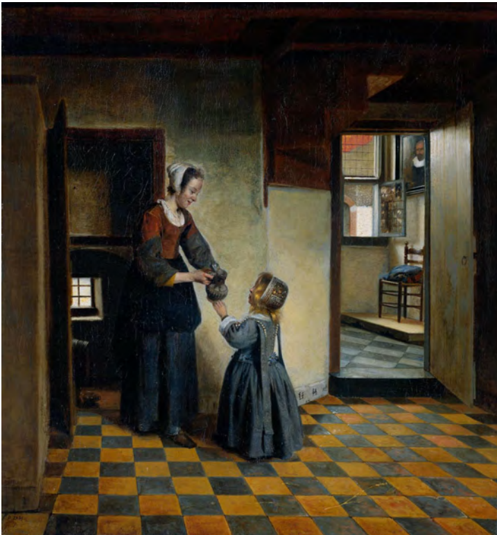
Abb. 136: Pieter de Hooch, Die Vorratskammer , um 1558. Öl auf Leinwand, 65 × 60,5 cm. Rijksmuseum, Amsterdam