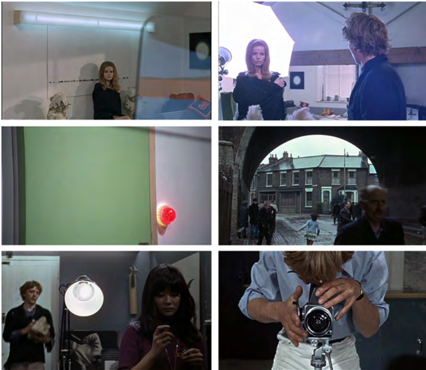
Abb. 129-134: BLOW-UP (1966). Michelangelo Antonioni, K: Carlo Di Palma