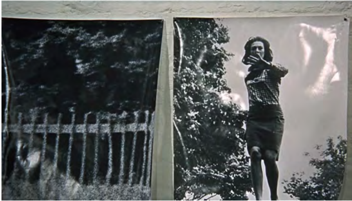
Abb. 127: BLOW-UP (1966). Michelangelo Antonioni, K: Carlo Di Palma