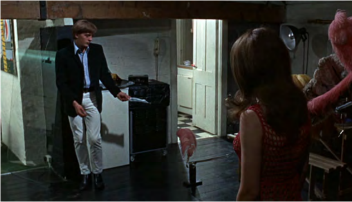
Abb. 135: BLOW-UP (1966). Michelangelo Antonioni, K: Carlo Di Palma