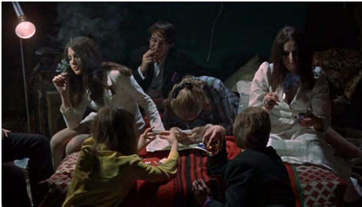
Abb. 137: BLOW-UP (1966). Michelangelo Antonioni, K: Carlo Di Palma

»For what is cinema really if not images, dreams, and visions? We take one more step, and we give up all movies and we become movies: we sit on a Persian or Chinese rug smoking one dream matter or another and we watch the smoke and we watch the images and dreams and fantasies that are taking place right there in our eye's mind: we are the true cineasts, each of us, crossing space and time and memory – this is the ultimate cinema of the people, as it has been for thousands and thousands of years.« 64