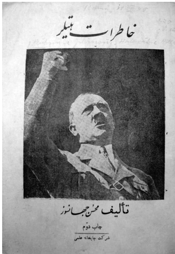
1 Übersetzung von »Mein Kampf« ins Persische. Hāṭīrāt-i Hītlir. Čāp-i 2. – [Tīhrān] : Širkat-i Taḏāmūnī-i 'Ilmī ; Širkat-i Čāpḩāna-i 'Ilmī, 1938 = 1317 h. š.

Es sind jedoch nicht sämtliche Auflagen einzelner Werke in der Bayerischen Staatsbibliothek vorhanden.