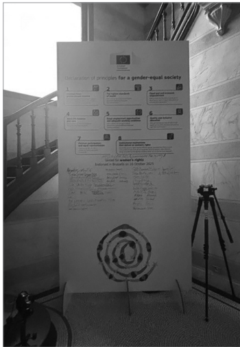
▲ Foto: Auch der djb hat mitgezeichnet.

ist für den internationalen Frauentag ein Fahrplan für Frauenrechte angekündigt worden. Die Umsetzung läuft tatsächlich und zeigt erste Erfolge.