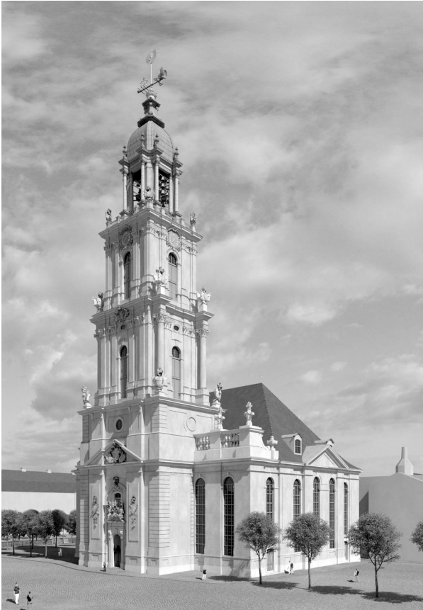
Abb. 9: Garnisonkirche Potsdam, Rendering einer Komplettrekonstruktion. Die Visualisierung der Garnisonkirche ist Teil der Panoramatur Potsdam 1850 und 2012 und wird von der Fördergesellschaft für den Wiederaufbau der Garnisonkirche e.V. verwaltet.

© Fördergesellschaft für den Wiederaufbau der Garnisonkirche e.V., Visualisierung: arte4D – Andreas Hummel, Arstempno 2013, Initiative »Bürger für die Mitte«. https://cms.panomaker.de/de/vt/potsdam1850/d/115885/siv/1