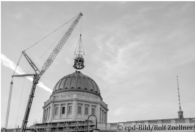
Abb. 8: Montage der Kuppelaterne auf dem Humboldt-Forum.

Dieses später hinzugekommene Bauteil wurde nun auch vollständig originalgetreu ausgeführt, einschließlich eines Kuppelkreuzes und einer Inschrift, welche die reaktionäre Haltung des damaligen Bauherrn zum Ausdruck brachte. Das Kuppelkreuz krönte einst die unter der Kuppel befindliche Schlosskapelle. Doch heute befindet sich hier ein Teil der außereuropäischen Sammlung. Was soll es bedeuten, dass diese nun von einem christlichen Symbol bekrönt werden? Über die Rekonstruktion des Kreuzes entbrannte eine Debatte, bei dem Befürworter*innen dieses als Bekenntnis zum Christentum und damit zugleich als Zeichen von Nächstenliebe, Toleranz, Weltoffenheit und Versöhnung verstanden wissen wollen. Die gleichzeitig mit dem Kreuz von König Friedrich Wilhelm IV. angebrachte