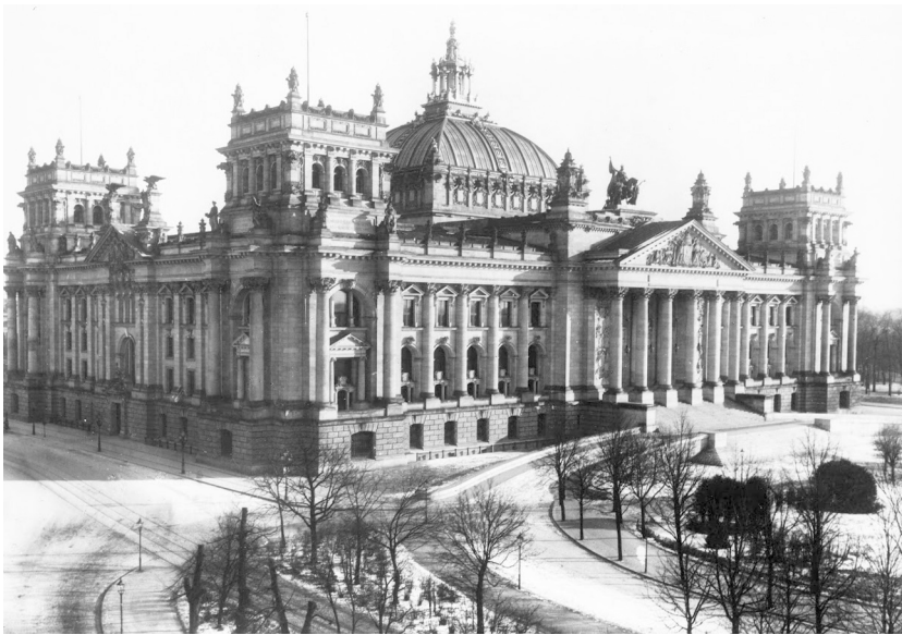
Abb. 3: Paul Wallot: Reichstagsgebäude Berlin 1882-1894, Ansicht von Westen.